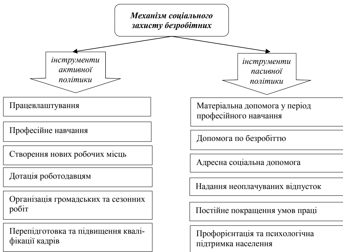
Рис. 3. Механізм соціального захисту безробітних в Україні (сформовано авторами на основі джерела [13])

Проблема безробіття набула актуальності та зумовила необхідність соціального захисту безробітних ще на початку 90-х років ХХ ст., що, у свою чергу, зумовило прийняття законодавчих актів, які передбачали механізм створення спеціальних фінансових джерел для надання матеріальної підтримки безробітним, а також поклали певні зобов'язання на державні органи та роботодавців у сфері зайнятості. Механізм соціального захисту безробітних в Україні на сьогодні є комплексним та передбачає взаємодію інструментів як активного, так і пасивного впливу (рис. 3) [5].