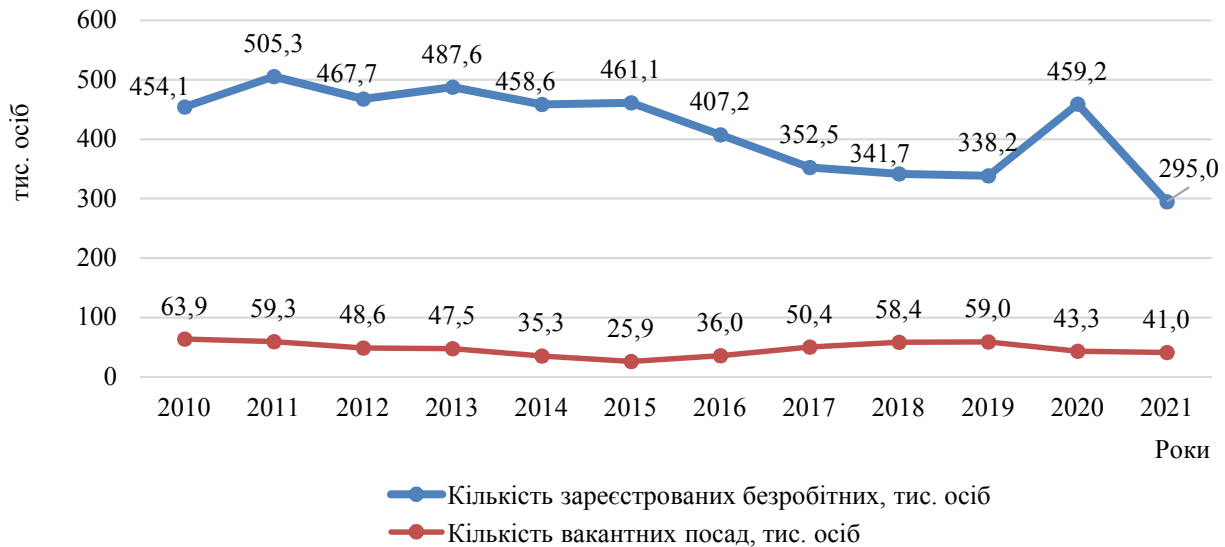
Рис. 4. Динаміка відповідності попиту та пропозиції робочої сили за 2010–2021 рр. (сформовано автором на основі даних [12])

встановлення динаміки соціального захисту від безробіття необхідно проаналізувати попит і пропозицію робочої сили серед безробітних за даними державної служби зайнятості у період з 2010 по 2021 р. (рис. 4).