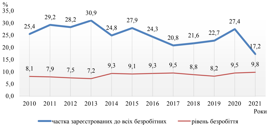
Рис. 1. Динаміка рівня безробіття та частки зареєстрованих до всіх безробітних (сформовано авторами на основі джерела [8])

сягнувши найнижчого рівня у 2021 р. – 17,2%. Це свідчить як про те, що значна частина населення має неофіційне працевлаштування, так і про те, що більшість непрацюючого населення не сподівається знайти роботу через центри зайнятості і навіть не звертається до них.