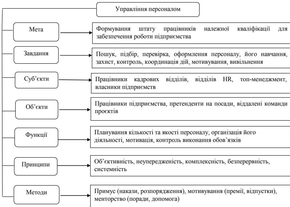
Рис. 1. Елементи системи управління персоналом організації (сформовано авторами на основі джерела [5])

виокремлені твердження про холистичний менеджмент, формування персоналу можемо трактувати як холистичну функцію у системі управління персоналом в умовах оптимізаційного розвитку. На рис. 2 побудовано модель формування персоналу як оптимізаційного бізнес-процесу управління персоналом на засадах холистичного менеджменту. В основі розвитку цієї моделі закладено концептуальні засади управління талантами. Адже в умовах транзитивних процесів підприємств, що передбачає їхню оптимізацію, застосування цієї функції та використання технологій, орієнтованих на розкриття потенційних можливостей працівників, формування бази талантів набуває особливого значення.