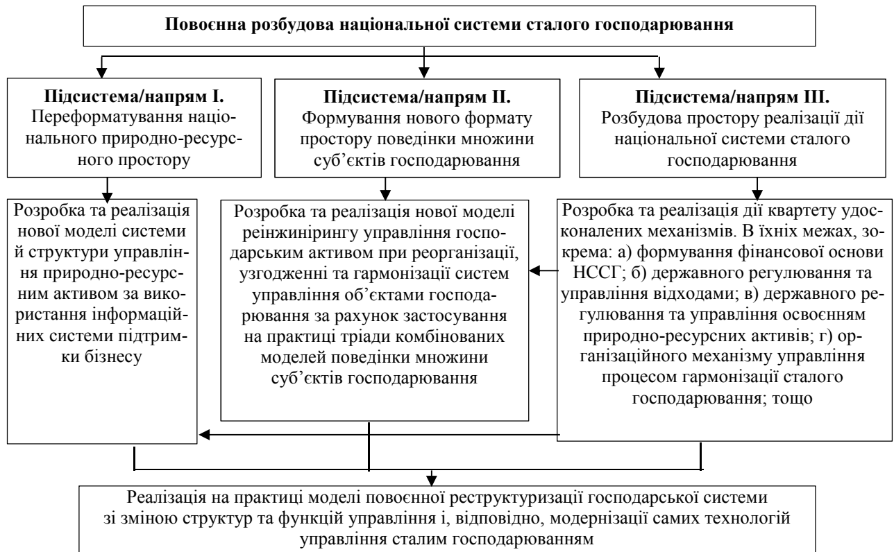
Рисунок. Концептуальна схема повоєнної розбудови національної системи сталого господарювання за пріоритетними напрямками на засадах реалізації концептуального проекту реструктуризації господарської системи

в) визначити й обґрунтувати масштаби, терміни та режими фінансування.