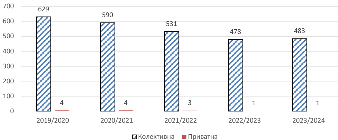
Рис. 1. Розподіл закладів позашкільної музичної освіти України за формою власності, од.

На національному ринку освітніх послуг закладів позашкільної музичної освіти функціонують заклади комунальної та приватної форм власності (рис. 1).