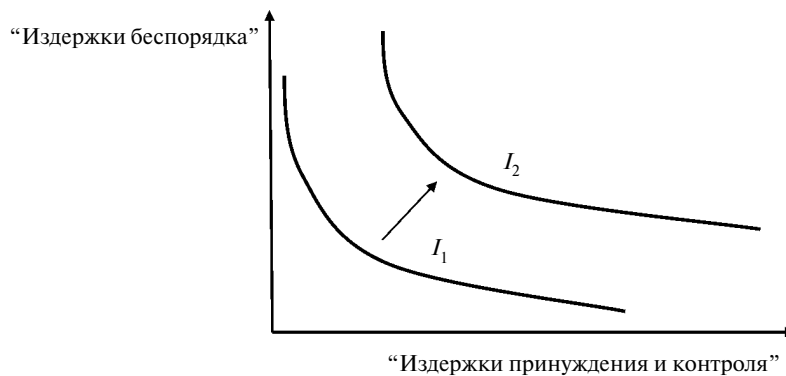
Рис. 2. Социальный капитал и пределы институциональных возможностей

гражданским обществом (“плата за отсутствие демократии”). Например, ненадлежащее качество автомобильных дорог в Украине и России является причиной многочисленных ДТП, убытки от которых исчисляются не только стоимостью утраченного имущества, но и здоровьем и жизнью граждан. Возмещение же причиненных убытков организациями, несущими ответственность за качество общественного блага “автомобильная дорога”, через судебную систему в условиях “слабости” институтов гражданского общества часто является нереальным в связи с бюрократизмом, коррупцией, пробелами в законодательстве. К тому же недостаточно исследований, которые бы обосновывали потери общества от инвалидности или смерти граждан (в стоимостном выражении недополученного ВВП и неуплаченных налогов) по сравнению с расходами на надлежащее содержание автомобильных дорог или качественное финансирование других общественных благ.