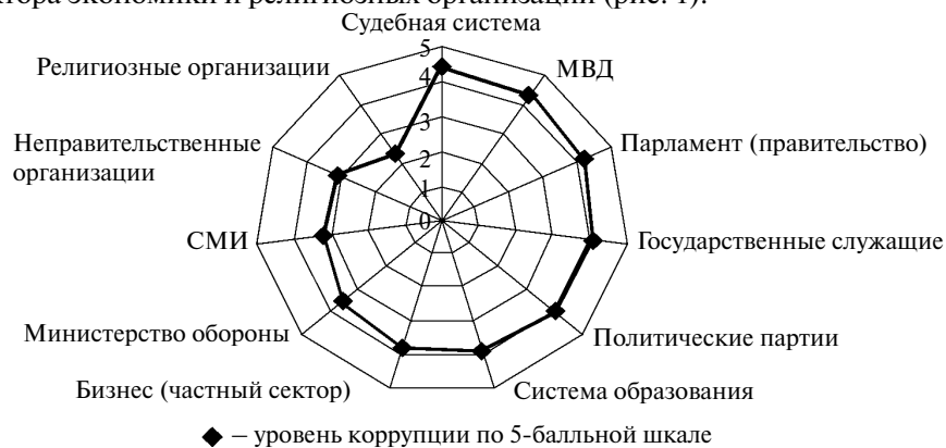
Рис. 1. Уровень коррупции в Украине в 2011 г. *