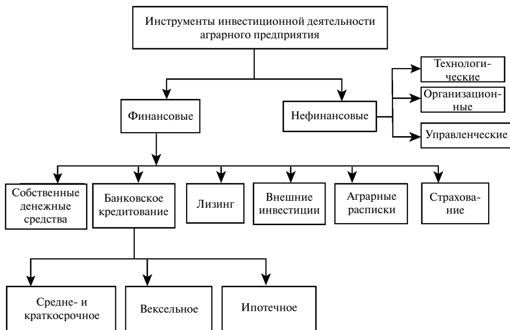
Рис. 1. Инструменты инвестиционной деятельности аграрного предприятия

рациональной деятельности предприятия, направленной на реализацию его инвестиционной стратегии. Поэтому инструменты инвестиционной деятельности предприятия являются комплексными. Можно выделить две группы таких комплексных инструментов инвестиционной деятельности предприятия: финансовые и нефинансовые. В свою очередь, финансовые инструменты делятся на банковское кредитование, лизинг, собственные денежные средства предприятия и денежные средства инвесторов, а нефинансовые – на технологические, организационные и управленческие. Структурно инструменты инвестиционной деятельности аграрного предприятия можно представить в следующем виде (рис. 1 и 2).