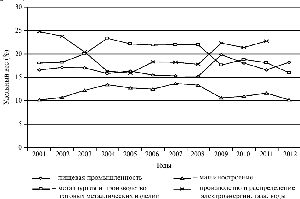
Рис. 1. Динамика удельного веса продукции отдельных отраслей промышленности в общем объеме реализованной продукции

В 2001–2013 гг. в общем объеме реализованной продукции высоким был удельный вес продукции следующих отраслей: производство и распределение электроэнергии, газа, воды; металлургия; пищевая промышленность; машиностроение (рис. 1).