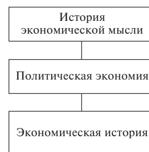
Рис. 2. Логико-историческое познание

Экономическая теория как наука изучает экономические отношения и представляет собой разветвленную систему знаний, отражающих определенные аспекты, срезы, формы, пространственно-временные локализации и другие спецификации экономических отношений. Чтобы определить место каждой особой экономической науки в их общей системе, необходимо выяснить специфику предмета и метода каждой из них.