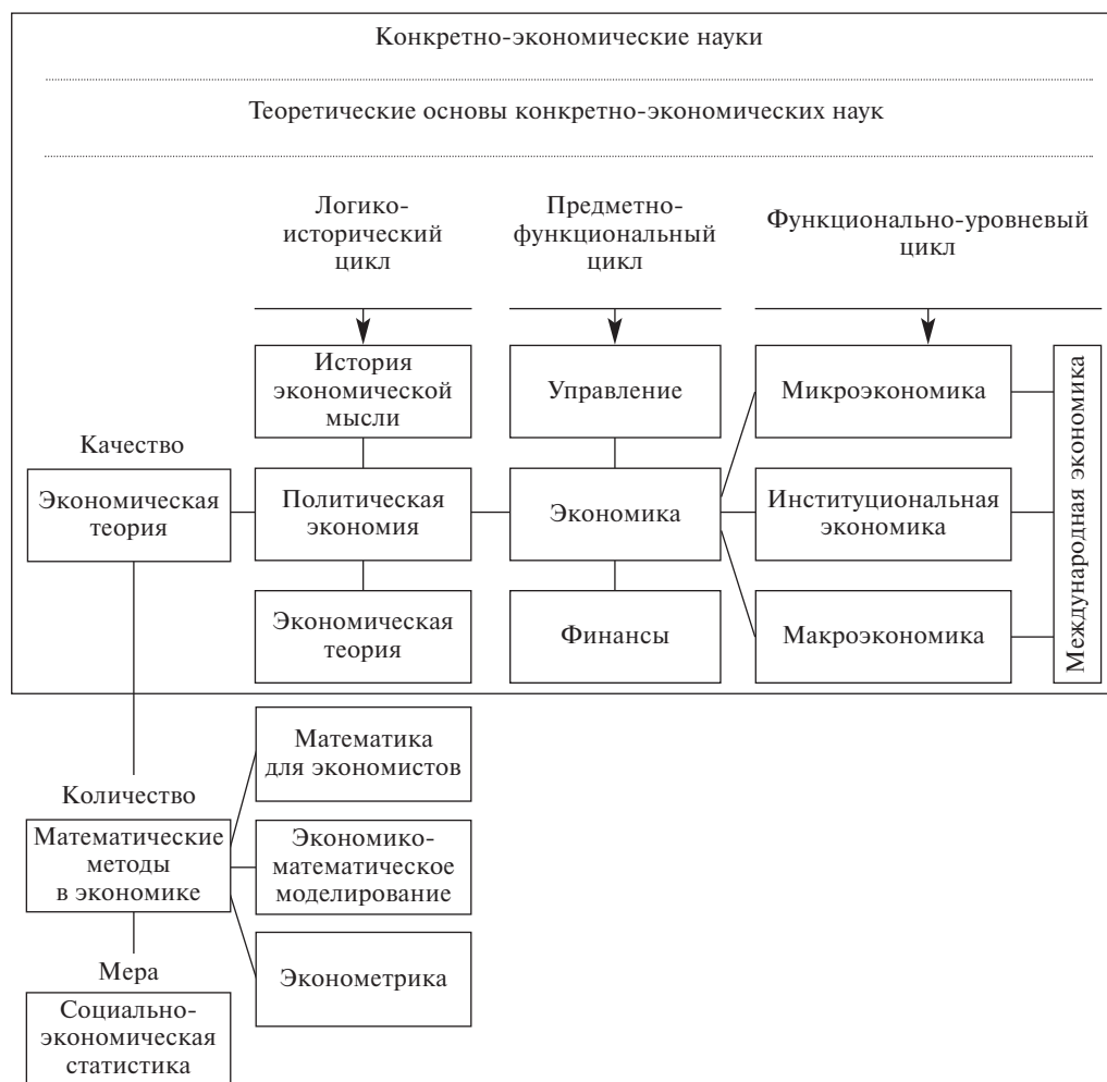
Рис. 5. Логическая схема построения образовательных программ по экономике