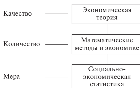
Рис. 1. Дифференциация дисциплин по критериям меры познания экономической реальности

Познание сущности всегда базируется на логико-исторической методологии, в логической форме отражая историю возникновения и развития предмета. Эта задача решается политической экономией, экономической историей и историей экономической мысли. Экономическая история раскрывает реальные исторические изменения в экономических отношениях, история экономической мысли – их отражение в теории, а политическая экономия объединяет все это в логически обобщенной форме. Именно эти дисциплины и эта методология дают ключ к познанию сущности (рис. 2).