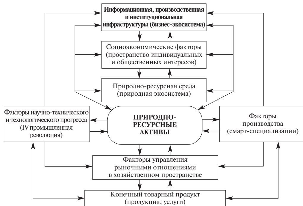
Рис. 1. Природно-ресурсные активы в системе благоустройства пространственного развития

Вместо этого актив предполагает институциональную интеграцию ресурса в пространственную систему (рис. 1). Для его превращения в полноценный актив не-обходимо природный капитал включить в хозяйственный оборот. В свою очередь, это требует разработки определенного организационно-экономического механиз-ма по их включению в соответствующие информационно-энергетические потоки. Таким образом, с развитием предпринимательских структур за счет природных ре-сурсов происходит обновление экономического пространства, упорядочение харак-тера взаимодействия экономических акторов, а в завершение – повышение уровня конкурентоспособности территориальных образований в целом.