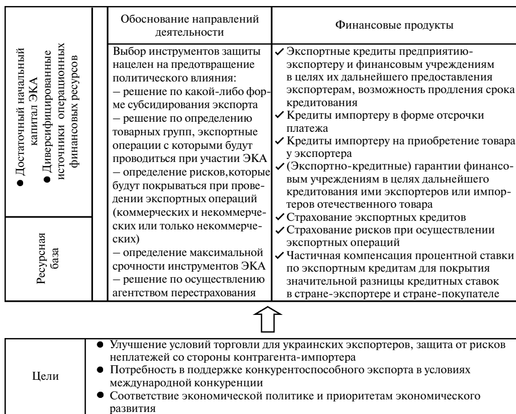
Рис. 1. Схематическая модель ЭКА

ветствующий год и другие денежные средства. Под доступом к указанным ресурсам понимаются готовность отечественных и иностранных частных инвесторов, банков развития и МФО к финансированию ЭКА на возвратной или безвозвратной основе, а также предоставление украинским экспортерам торгового финансирования в рамках застрахованных ЭКА операций по стоимости, близкой к стоимости суверенного риска, которая, безусловно, будет зависеть от рейтингов ЭКА, установленных международными рейтинговыми агентствами. В соответствии с этим законом, первоначальный уставной капитал ЭКА, сформированный за счет денежных средств государственного бюджета, должен составлять не менее 200 млн. грн. (или, по нынешнему курсу гривни по отношению к доллару по состоянию на 31 марта 2018 г., 7,5 млн. дол.) по сравнению с объемом отечественного экспорта товаров и услуг, который достигает свыше 51 млрд. дол. (см. табл. 1). Такой доступ к финансированию (особенно – иностранного происхождения) зависит от мощной капитализации ЭКА, что свидетельствовало бы о государственной поддержке и долгосрочных намерениях власти в отношении деятельности агентства, связанной со страховой защитой экспортных операций при любых финансовых трудностях. Поэтому будет целесообразно увеличить минимальный законодательно установленный уровень капитализации ЭКА.