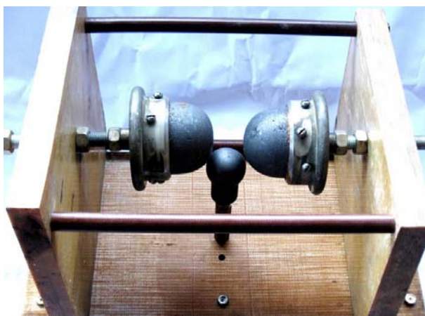
Рис. 1. Общий вид сверху высоковольтного трехэлектродного воздушного коммутатора с графитовыми основными и управляющим электродами типа КВТГ-50 на номинальное напряжение \pm 50 кВ и импульсный ток амплитудой до \pm 220 кА микросекундного временного диапазона

стальных гаек М20 на массивных вертикальных изоляционных плитах (материал – СТЭФ) толщиной 30 мм, высотой 240 мм и шириной 250 мм.