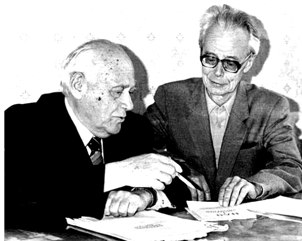
Рис. 8. Харьковские физики-теоретики, академики АН УССР Ахиезер А.И. (слева) и Волков Д.В. (справа) в рабочем кабинете лабораторного корпуса ХФТИ на старой площадке института по ул. Чайковского за обсуждением материалов новой проблемной задачи (1991 г., г. Харьков) [7]