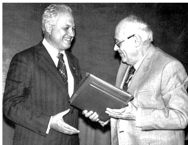
Рис. 7. Академик АН УССР Ахиезер А.И. (справа) на заседании Ученого совета ХФТИ принимает поздравления по случаю своего 70-летия (юбилейные адреса своему учителю вручает его талантливый ученик-академик АН УССР Барьяхтар В.Г. (слева), октябрь 1981 г., ХФТИ, г. Харьков) [28]