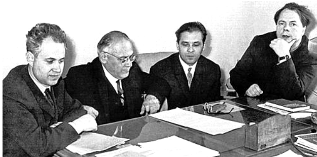
Рис. 4. Академик АН УССР Ахиезер А.И. (второй слева) со своими учениками-докторами наук и будущими украинскими академиками в области теоретической физики за обсуждением полученного решения важной физической задачи (слева-направо: В.Г. Барьяхтар, С.В. Пелетминский и К.Н. Степанов) (1960-е годы, УФТИ-ФТИ, г. Харьков) [28]