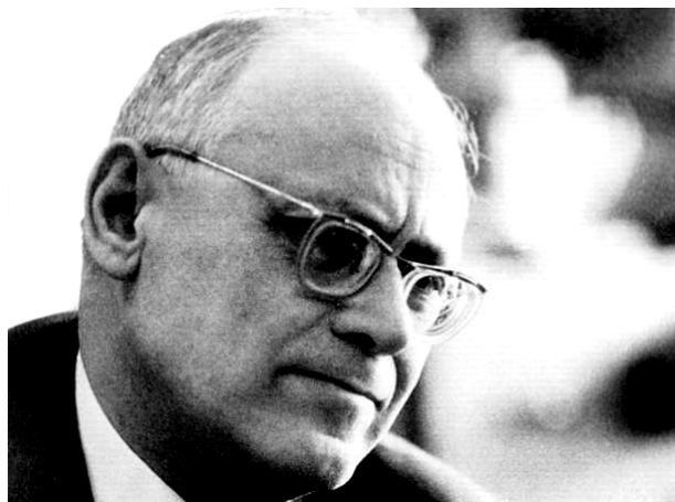
Рис. 5. Академик АН УССР Ахиезер А.И. в мыслях и раздумьях над сложными проблемами отечественной физической науки, путями ее выживания и дальнейшего развития в современных условиях (1970-е годы, ХФТИ, г. Харьков) [7]

• Государственной премией Украины в области науки и техники (2002 г., посмертно).