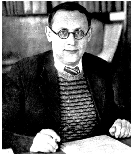
Рис. 3. Д.ф.-м.н., проф. Ахиезер А.И. в рабочем кабинете заведующего отделом теоретической физики УФТИ (в дни краткосрочного приезда из г. Москвы на «побывку» с семьей и сотрудниками института), возобновившего свою постоянную работу после тяжелых лет войны и военной эвакуации в г. Алма-Ату (1946 г., УФТИ-ФТИ, г. Харьков) [7]

теорию рефракции нейтронов (термин «рефракция» происходит от лат. слова « refractus » – «преломленный» и обозначает «преломление» [15]) и теорию поглощения нейтронов в однородных твердых средах [14]. Часть результатов этих исследований вошла в их совместную научную монографию «Некоторые вопросы теории ядра» (1948 г.), удостоенную в 1949 г. премии им. Л.И. Мандельштама АН СССР [14].