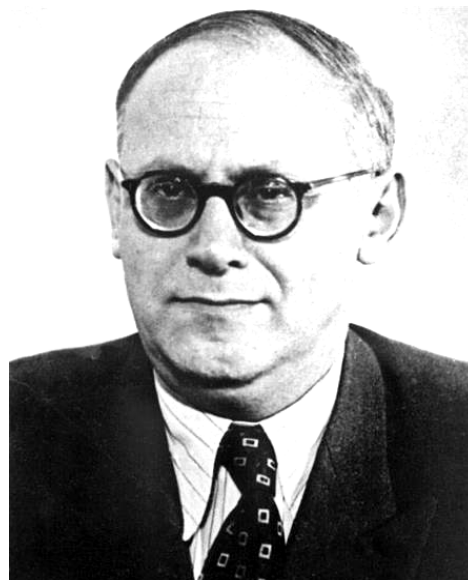
Рис. 1. Выдающийся советский и украинский физик-теоретик, д.-ф.м.н., проф., академик АН УССР (НАН Украины), заслуженный деятель науки и техники Украины, лауреат Государственных премий Украины в области науки и техники Александр Ильич Ахиезер (1911-2000 гг.) [7]

с сотрудниками всех других отделов УФТИ эффективно решали возложенные на них директивными органами советской страны сложные научно-технические задачи в области приоритетных направлений ядерной и экспериментальной физики, носящих преимущественно специальный (закрытый) характер. «Чистой» наукой сотрудники теоретических отделов УФТИ занимались только после решения своих непосредственных задач по научному сопровождению выполняемых в институте конструкторских разработок и изготовления на их основе в «металле» запланированных директивными решениями изделий. Используя форму краткого научно-исторического очерка, в меру своих физических знаний и эпистолярных способностей постараемся «нарисовать» многогранный портрет выдающегося отечественного физика-теоретика А.И. Ахиезера (рис. 1), ставшего одной из ярких легенд г. Харькова.