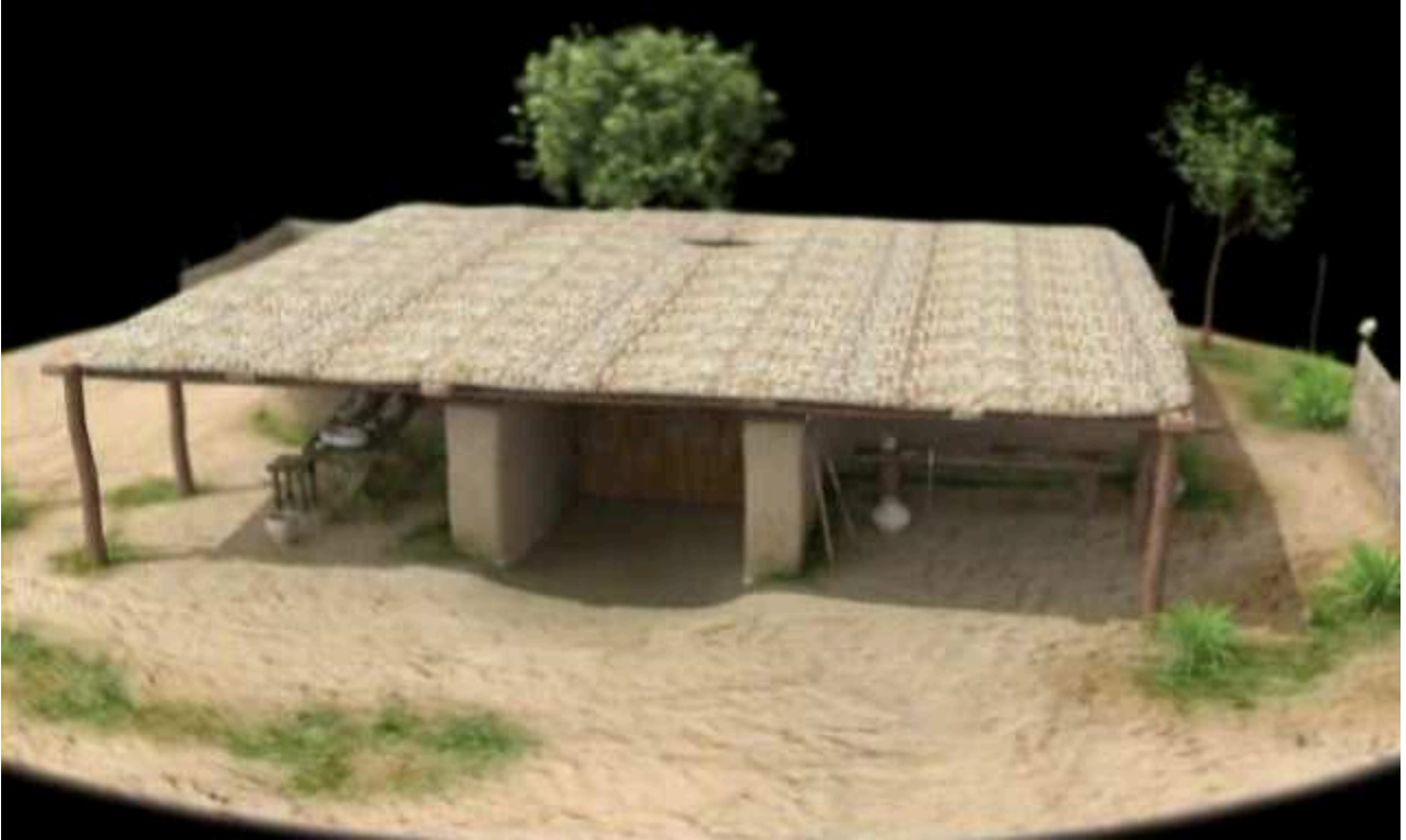
Рис. 3. Приміщення № 13. Зовнішній вигляд.