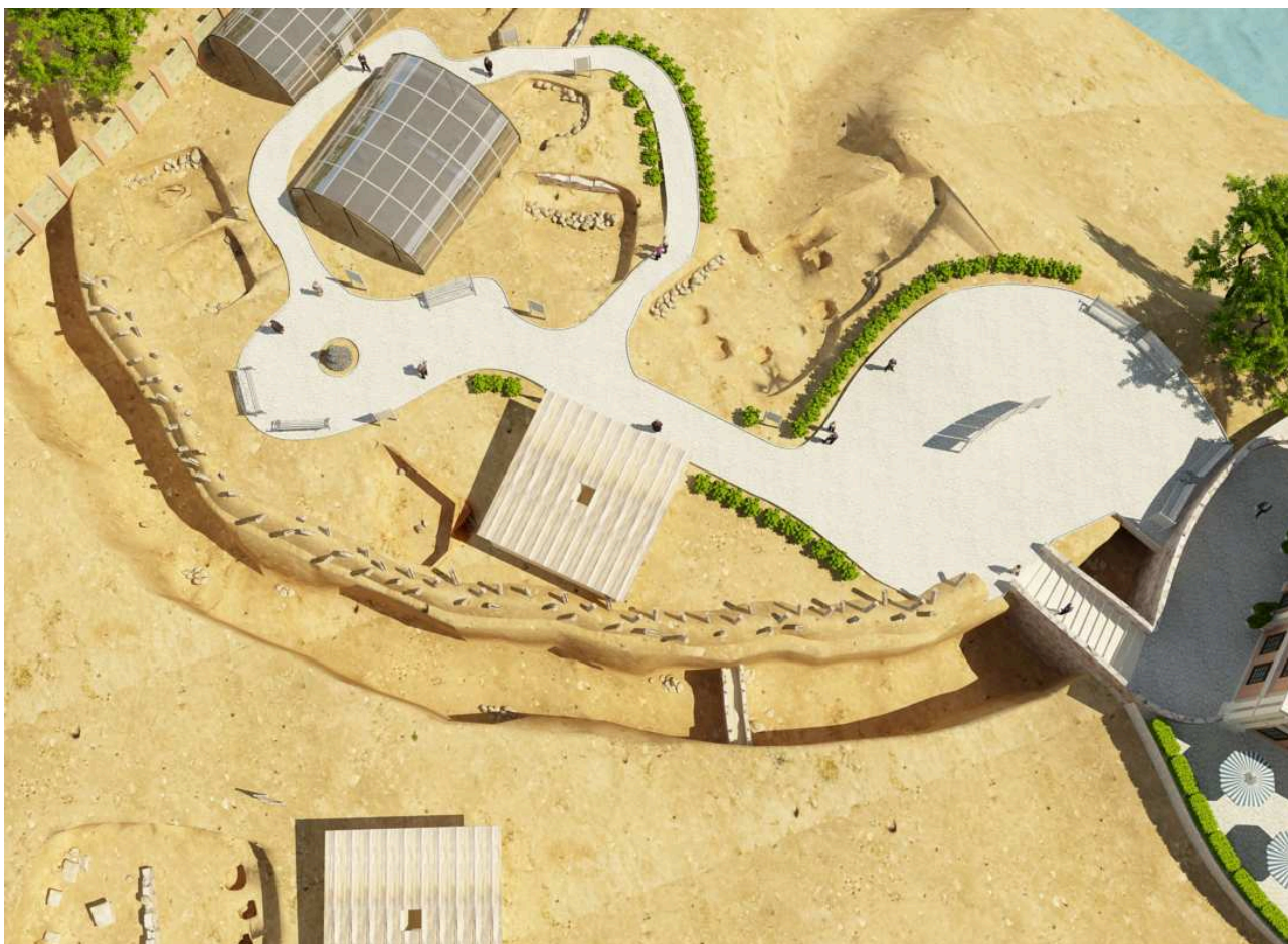
Рис. 5-6. Проект музея.