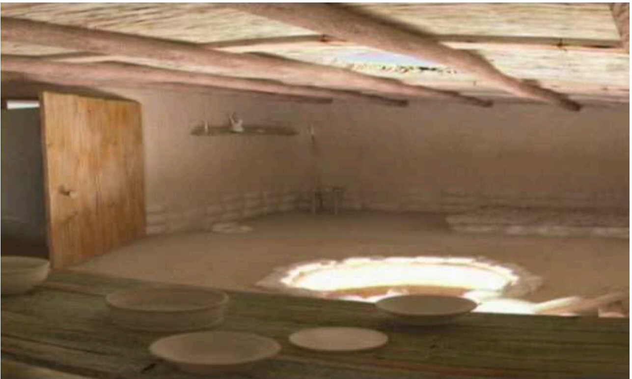
Рис. 4. Приміщення № 13. Внутрішній вигляд.