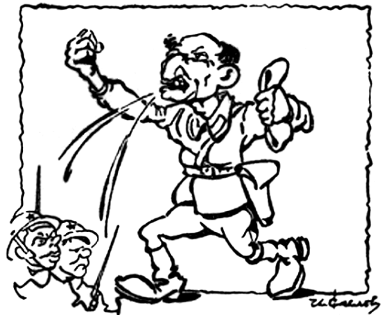
— За Родину. ..За веру православную! Мы Вас наградим орденами Кутузовича и Суворкина