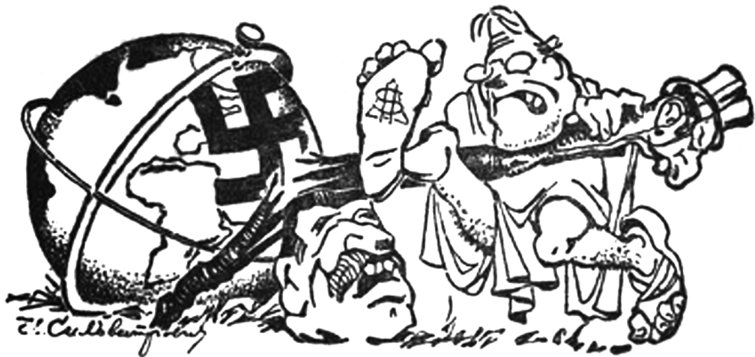
НЕО-АРХИМЕД: Дайте мне точку опоры и я переверну весь мир.