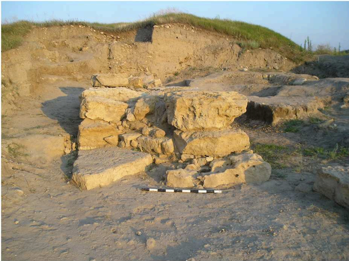
Рис. 3. Западная прирезка. Куртина № 77. Вид с В.