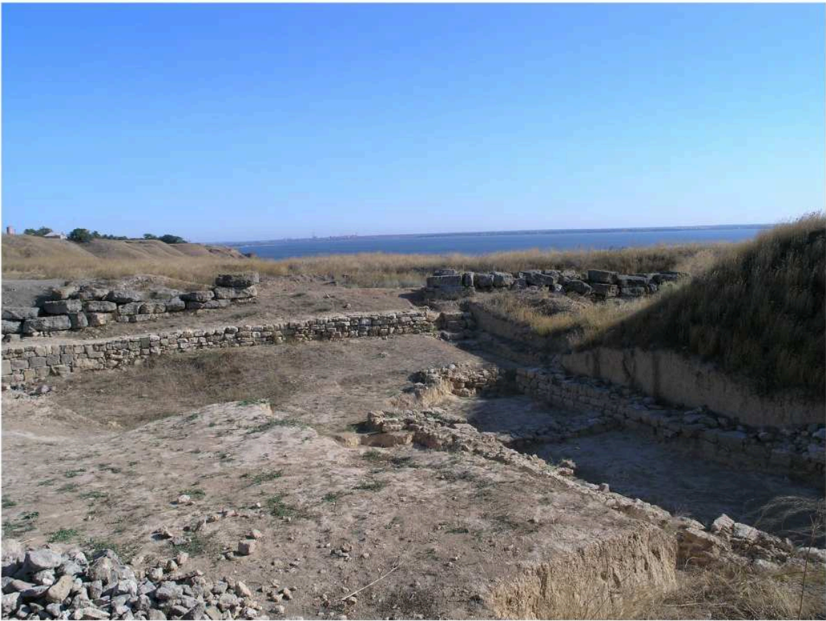
Рис. 1. Северная часть цитадели. Куртины № № 6, 8. Помещение “казармы”. Вид с Ю-З.