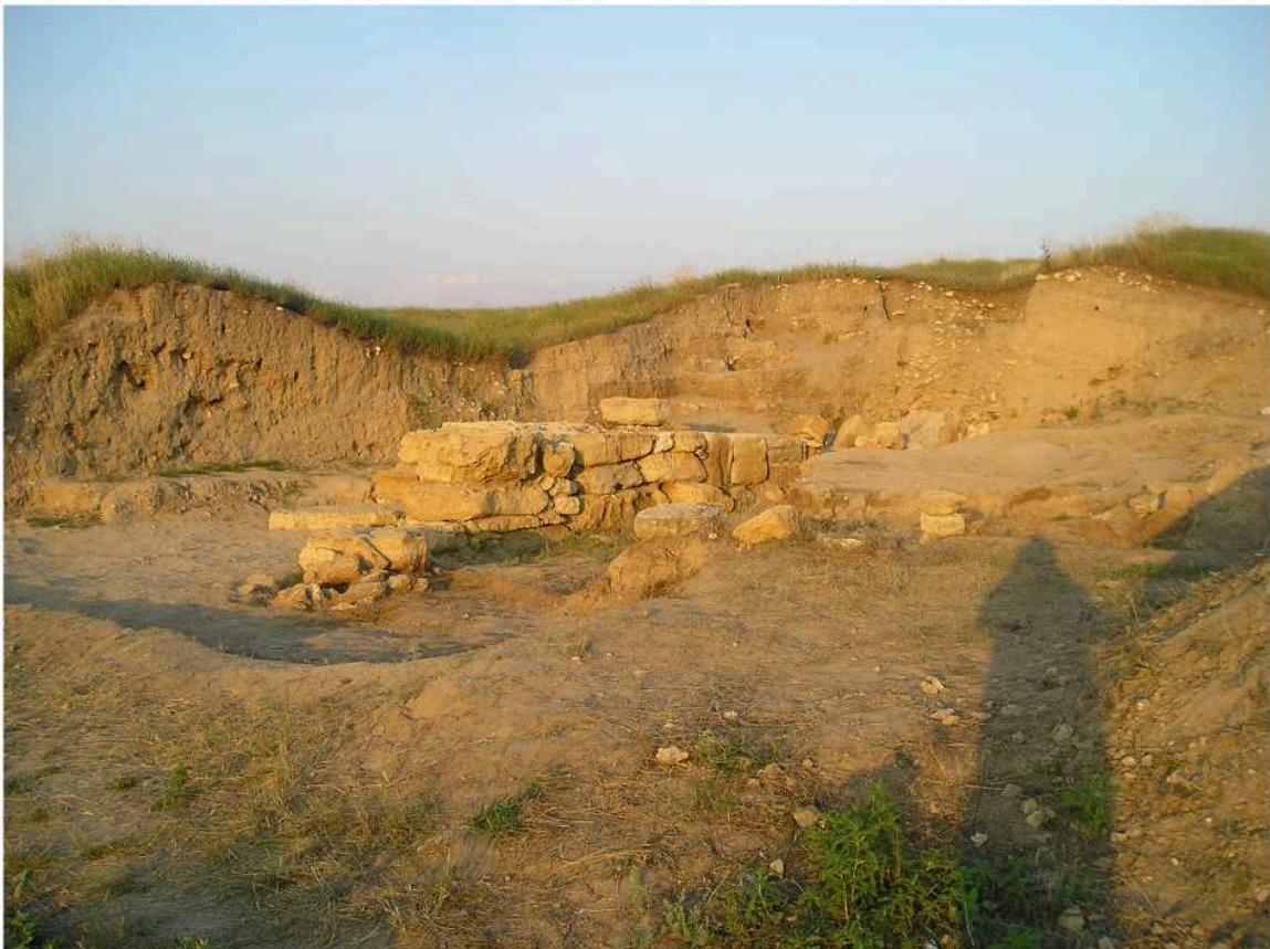
Рис. 2. Западная прирезка. Северо-западная куртина № 77. Вид с С-В.