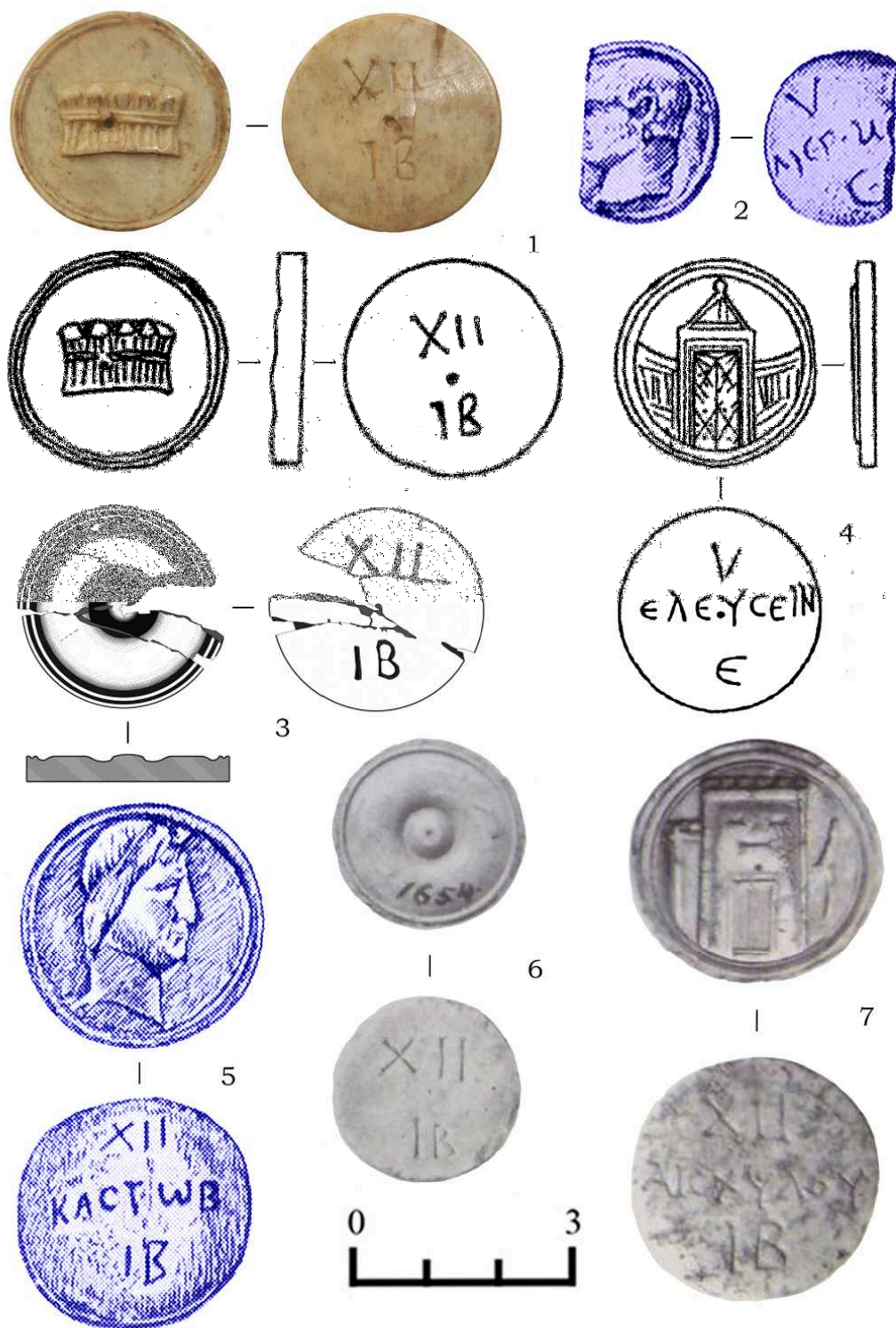
Рис. 1. 1 – Тира; 2 – Ольвия; 3 – Артезиан; 4 – Херсонес; 5 – Пантикапей; 6-7 – музей Кестнера.