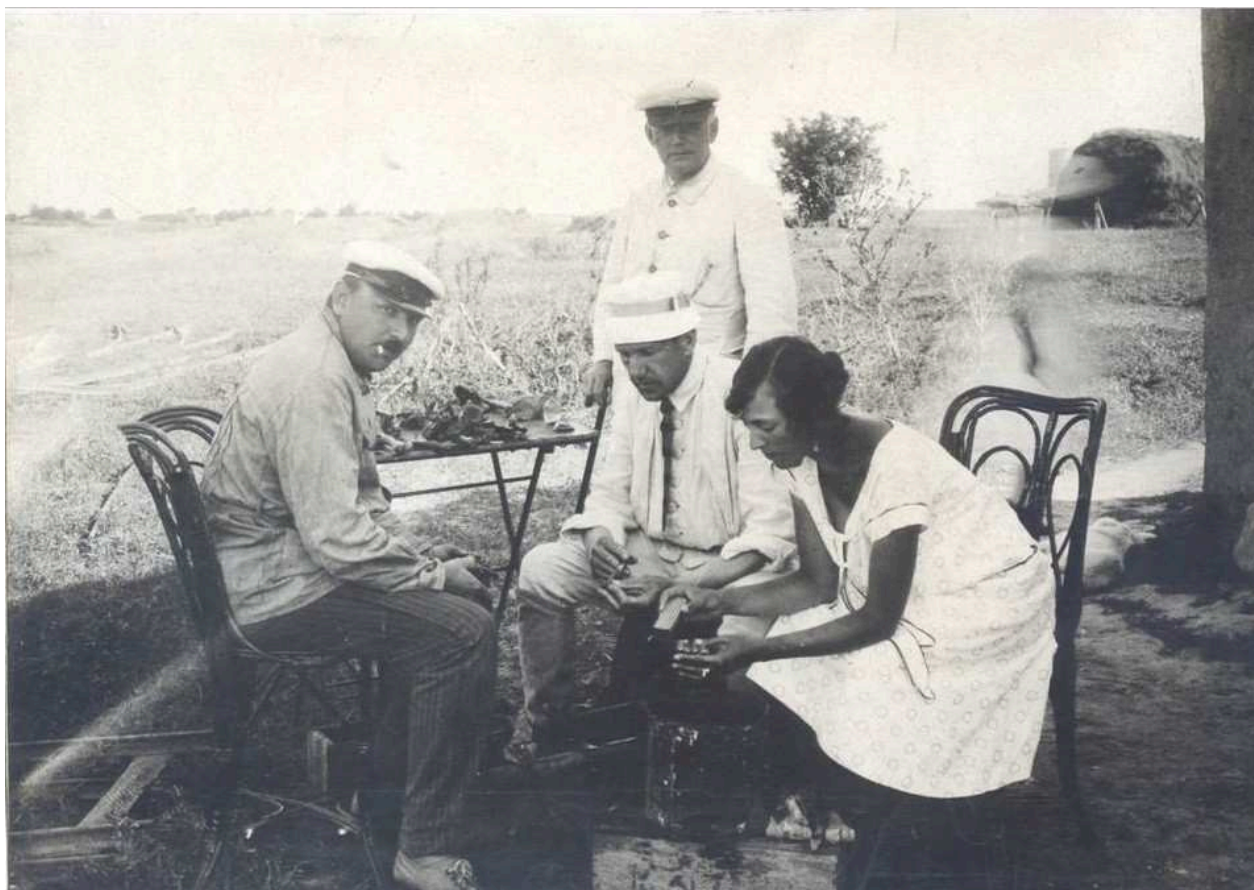
Рис.6. Б. В. Фармаковский с сотрудниками Ольвийской экспедиции. 1926 г.