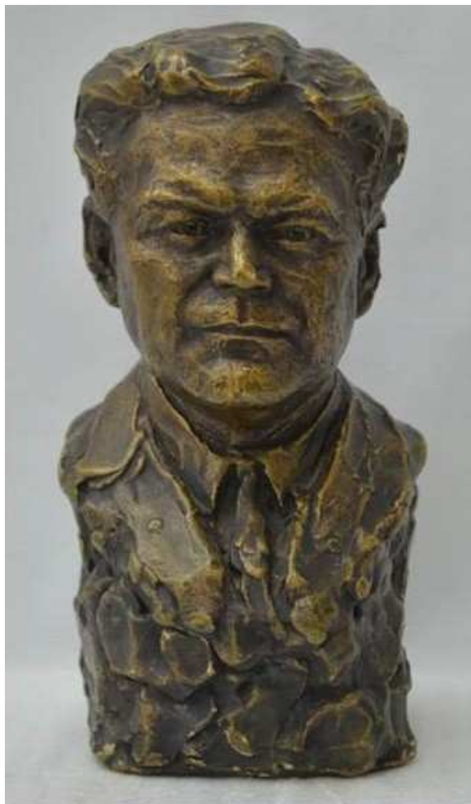
Рис. 7. Бюст Б.В. Фармаковского скульптора В. Штейн.