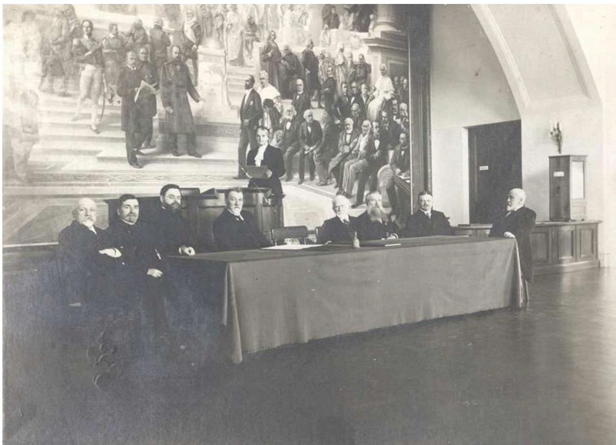
Рис. 5. Заседание Московского археологического общества.