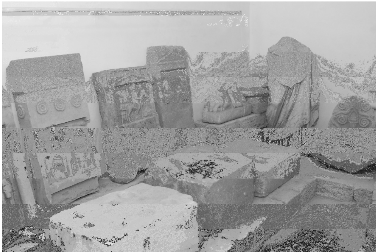
Рис. 8. Епіграфічні пам'ятки з Північного Причорномор'я