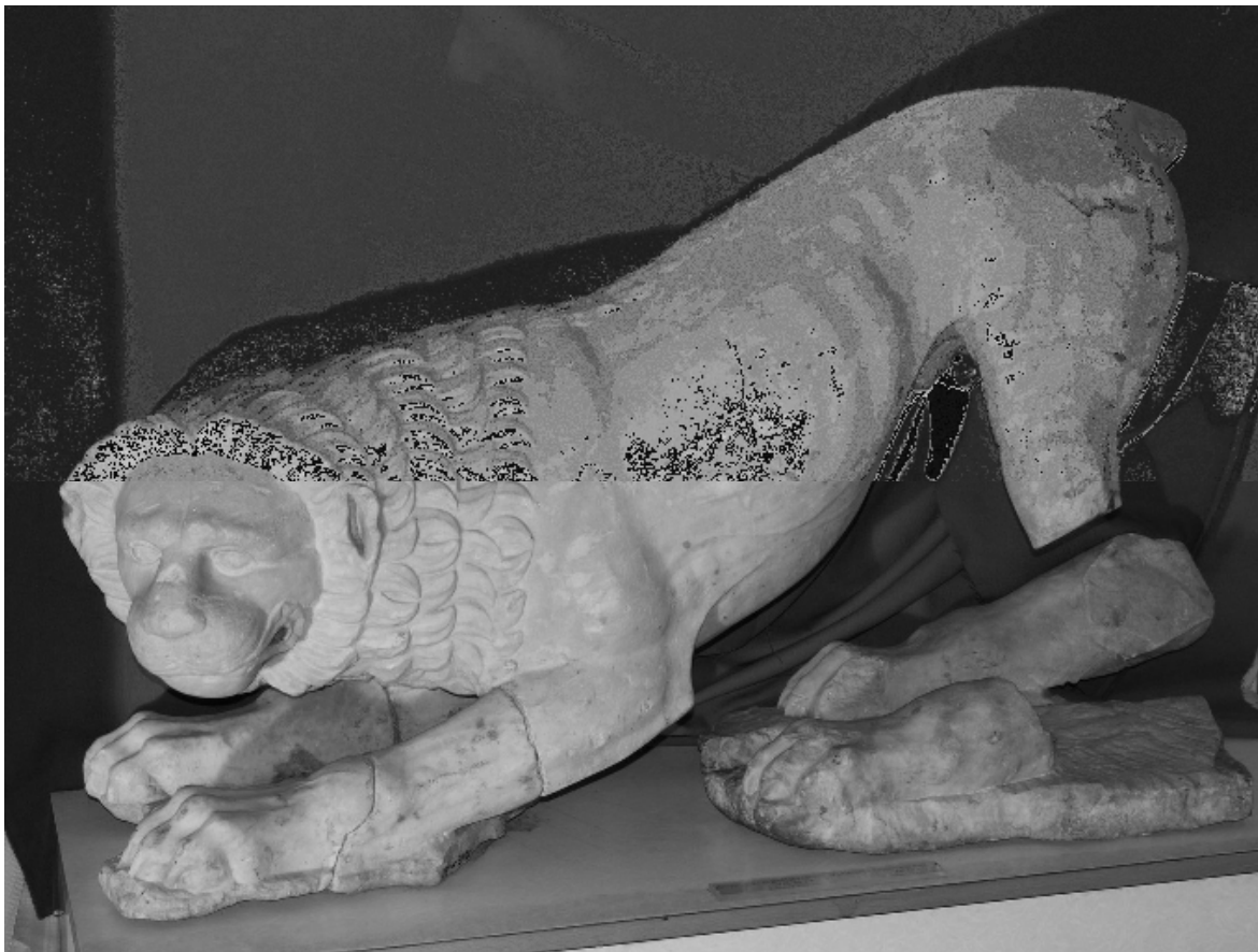
Рис. 7. Мармурова скульптура лева з Ольвії.

14. Лежух І., Черняков І. Перший молдавський археолог навчався і копав в Україні (до 150-річчя з дня народження І.К. Суручана) / Іван Лежух, Іван Черняков // Археологія . – 2001. – № 4. – С. 148.