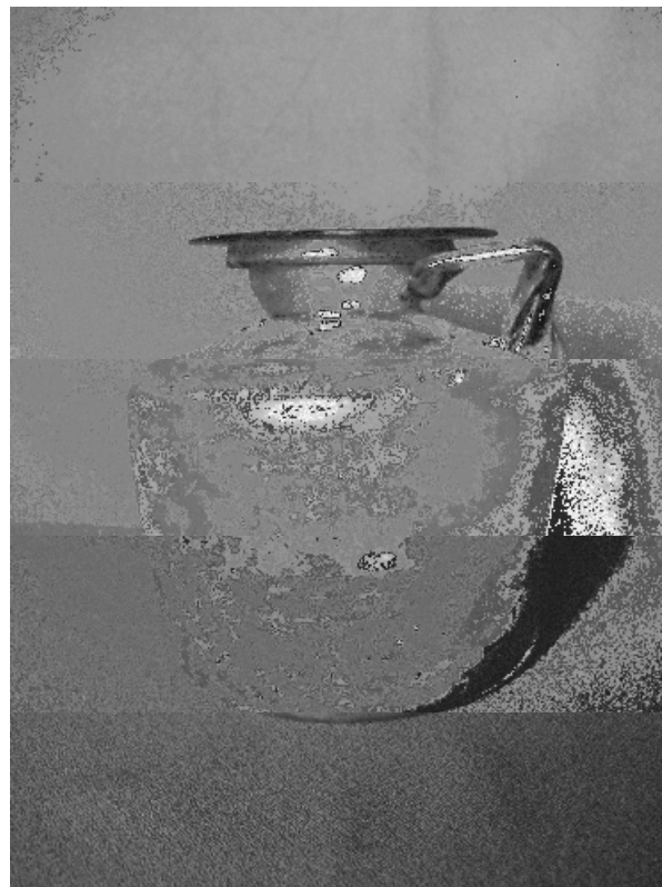
Рис. 3. Скляна посудина з Пантикапею

почувись про його поповнення, він не міг не зацікавитися можливістю придбати частину колекцій Музею старожитностей Понту Скіфського, попри вкрай несприятливий час – почалася Перша світова війна, а слідом і Лютнева революція.