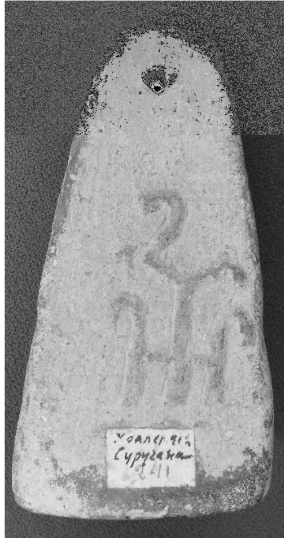
Рис. 4. Грузило усічено-пірамідальної форми I-II ст. н.е. з Ольвії

сучасного Відкритого археологічного фондосховища «Лапідарій – Амфорний зал», де лапідарні пам'ятки з античної колекції І.К. Суручана (окрім залучених до основної оглядової експозиції вищеназваних унікальних предметів) стали легкодоступними та зацікавленим дослідникам і пересічним відвідувачам музею.