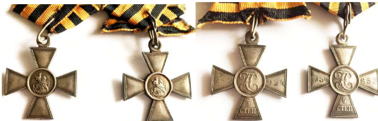
Рис. 5-6. Георгиевские кресты III степени № 162024 и IV степени № 54653 М.С. Капусты. Лицевая и оборотная стороны. Из коллекции авторов