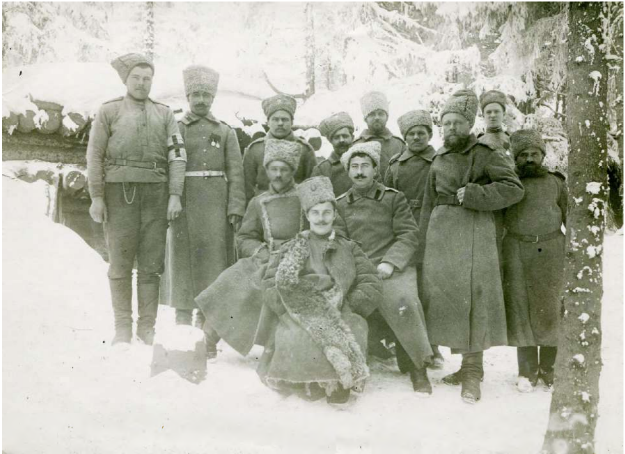
Рис. 9. Воины 254-го пехотного Николаевского полка возле блиндажа.