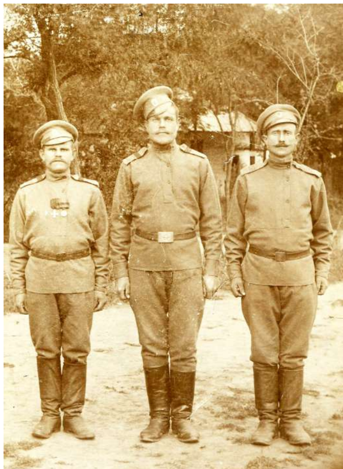
Рис. 3. Солдаты 254-го пехотного Николаевского полка.