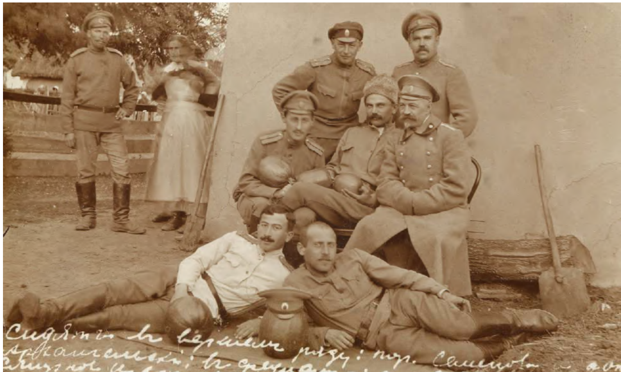
Рис. 10. Офицеры 254-го пехотного Николаевского полка, 8 октября 1917 года.