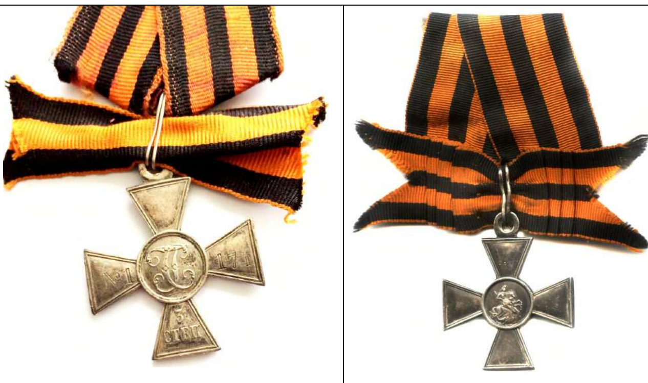
Рис. 7-8. Георгиевский крест III степени № 1174 Д.Е. Дзюбика. Лицевая и оборотная стороны. Из коллекции авторов