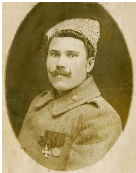
Рис. 4. Солдат 254-го пехотного Николаевского полка, награжденный Георгиевским крестом.