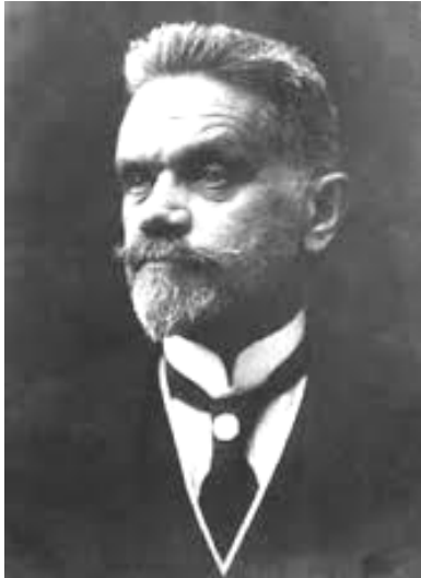
Фото 3. Л.О. Тарасевич (1868–1927)

ки він був «малоцікавим і нерозвиненим». Після другого розлучення княгиня К.В. Кудашева «зняла велику квартиру» в Москві, де й оселилася з сином Сергієм і подружжям Пренделів. Певною мірою такий розвиток подій підтверджує і сам Сергій Кудашев, вказавши в автобіографії про безперервне навчання у гімназії протягом чотирьох років [12, арк. 3].