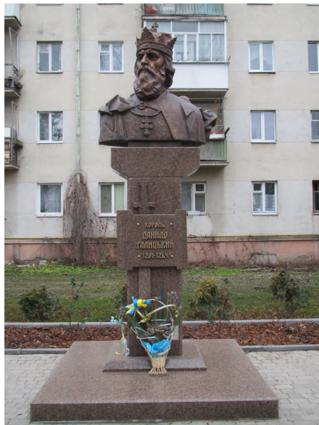
Рис. 14. Король Данило Галицький, м. Івано-Франківськ (пам'ятник авторства І. Семака)