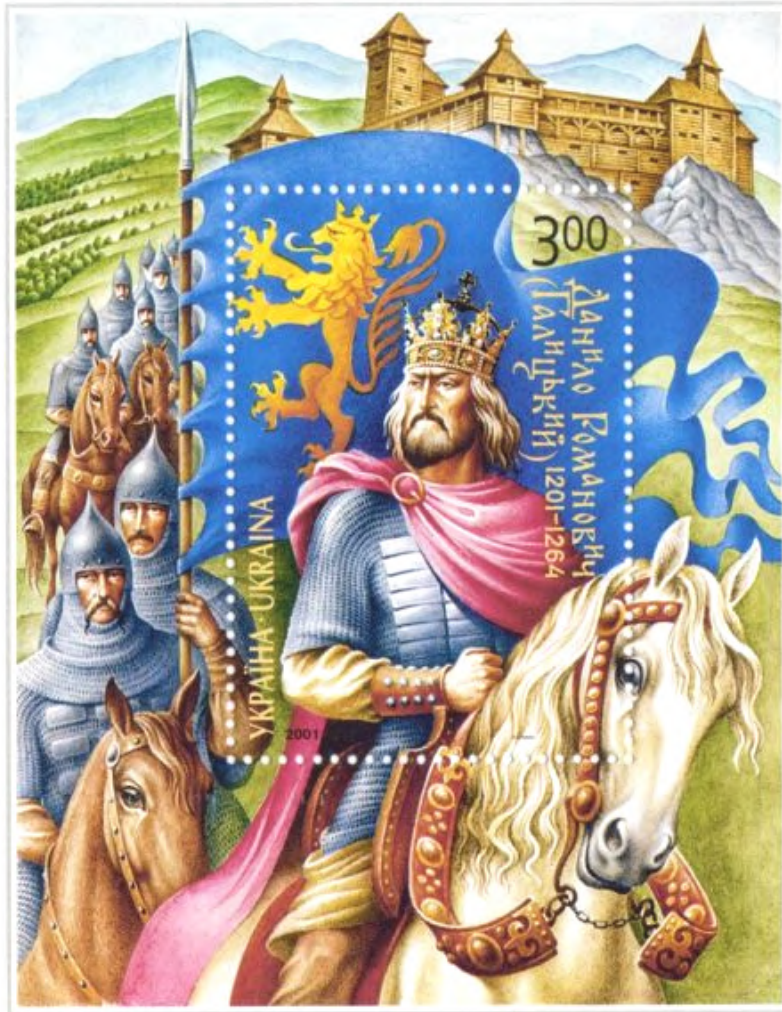
Рис. 2. Поштова марка «Данило Романович (Галицький)»