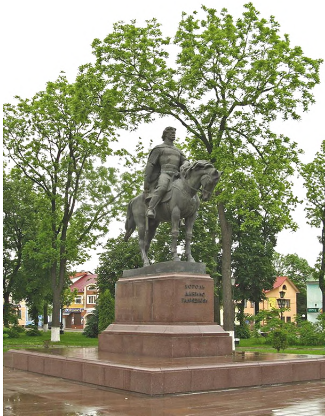
Рис. 11. Король Данило Галицький, м. Галич (пам'ятник авторства О. Пилева, О. Чамари)