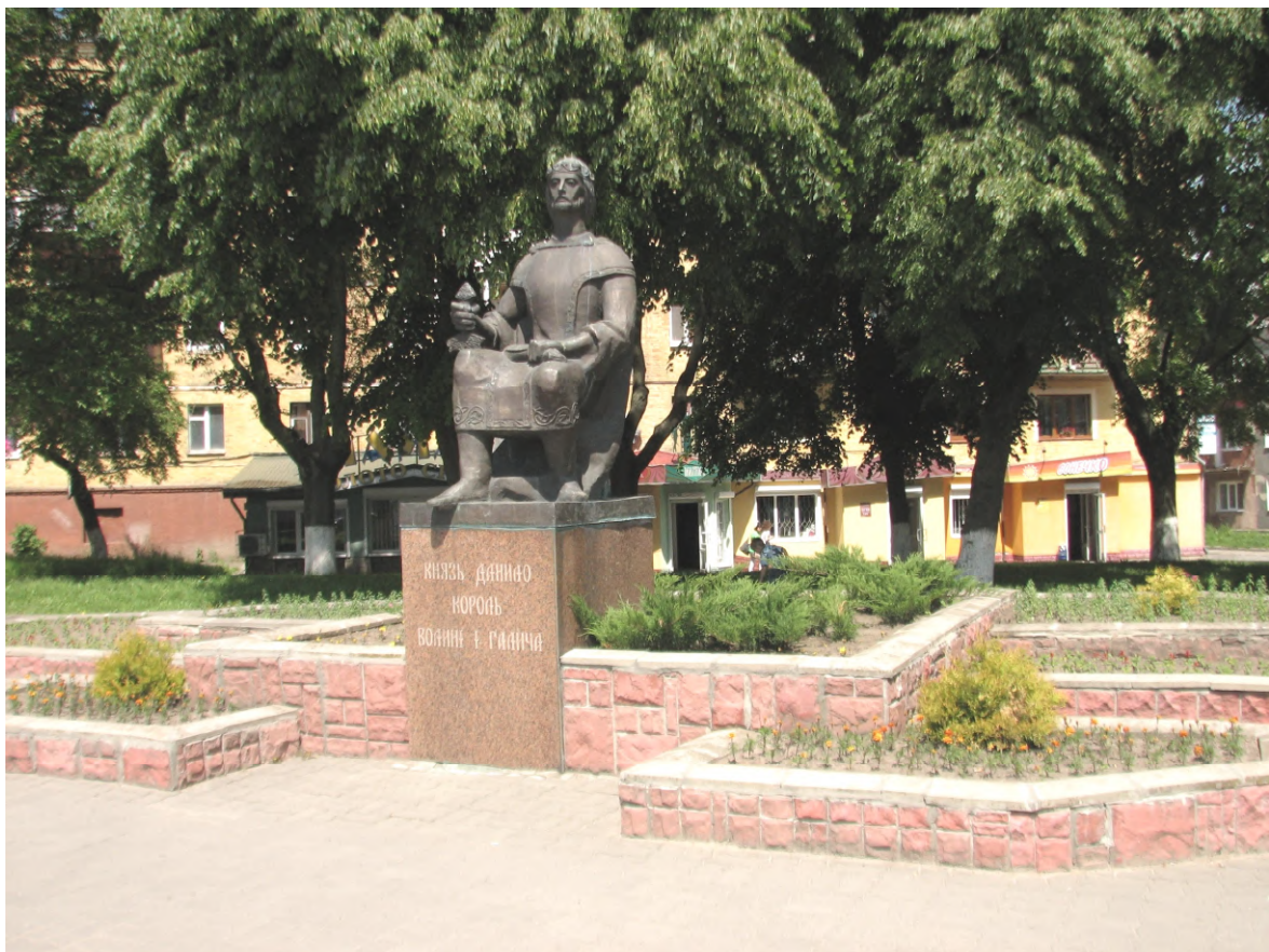
Рис. 12. Князь Данило король Волині і Галича м. Володимир-Волинський (пам'ятник авторства Т. Бриж)