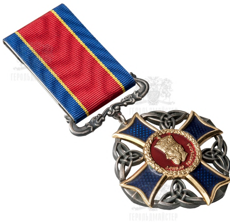
Рис. 1. Орден Данила Галицького

Схвалено до друку / Accepted: 11.09.2018