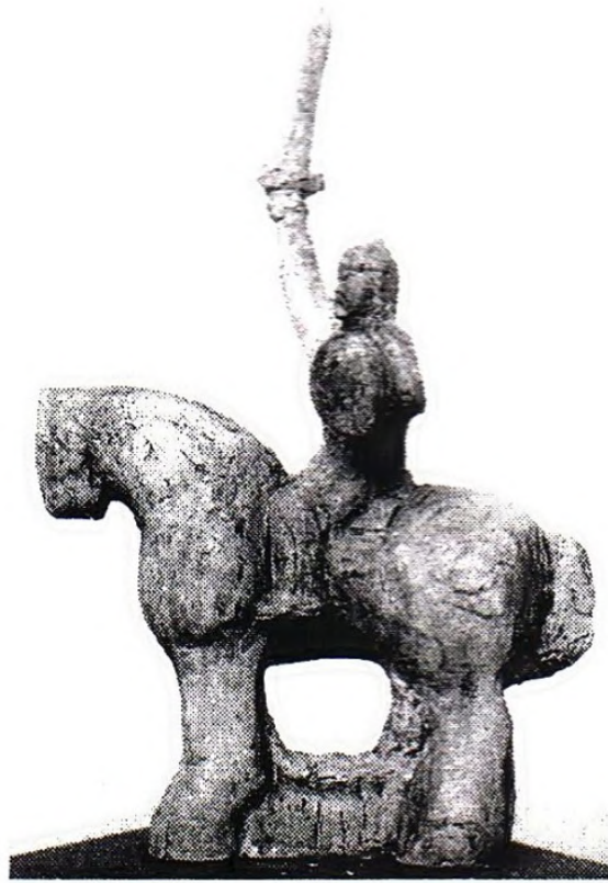
Рис. 6. Проект пам'ятника Данила Галицького (Я. Мотика, Львів)