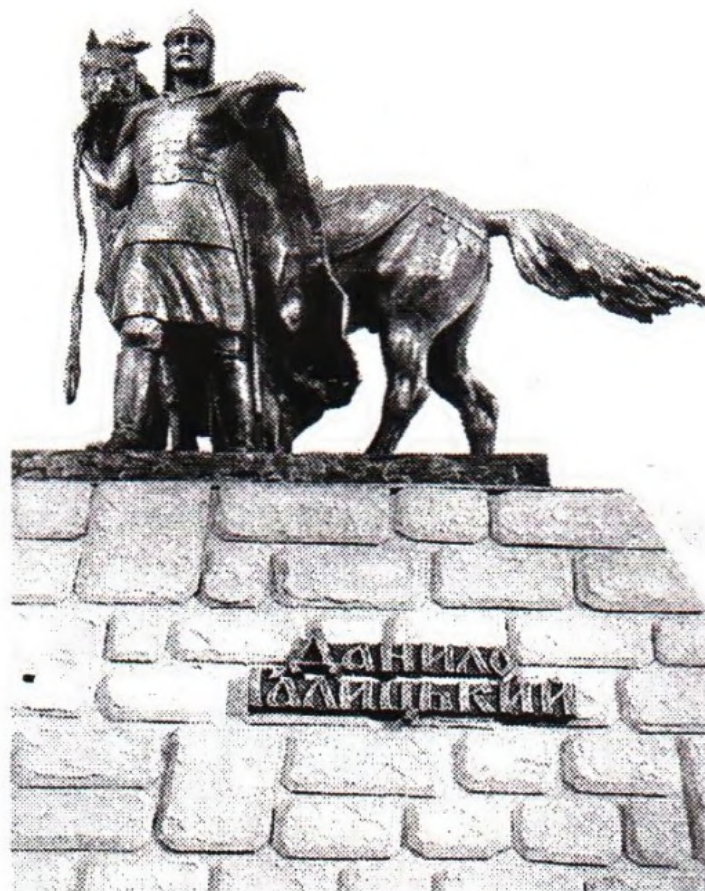
Рис. 5. Проект пам'ятника Данила Галицького (Я. Троцько, Львів)