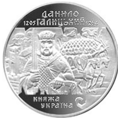
Рис. 4. Ювілейна монета із серії «Княжа України» – «Данило Галицький»