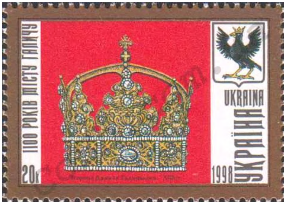
Рис. 3. Поштова марка «Корона Данила Галицького»