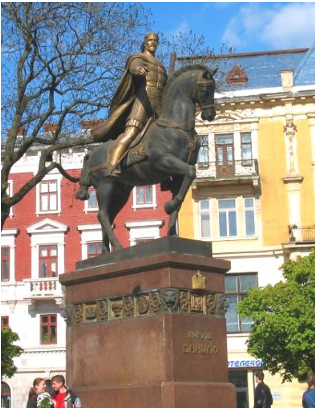
Рис. 9. Король Данило, м. Львів (пам'ятник авторства В. Ярича, Р. Романовича)