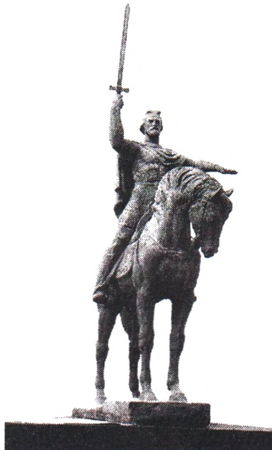
Рис. 7. Проект пам'ятника Данила Галицького (Е. Мисько, Львів)