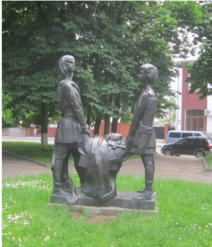
Рис. 13. Данило і Василько, м. Володимир-Волинський (пам'ятник авторства Т. Бриж)