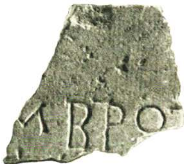
Рис. 3. Посвящение IOlb 125 .

Во фрагменте IOlb 125 сохранилась частично первая строка, восстанавливаемая известным в Ольвии именем (или патронимом) [... Κλεό]μβροτ[ο...] и незначительные следы букв второй. Издатель отнес надпись к посвященным и датировал ее не ранее конца III-II вв. до н.э. Объединённые горизонтальной чертой вверху, крупные литеры βετα и ρο фрагмента IOlb 125 , выходят за верхний габарит строки, имея высоту 27 мм (по Е.И. Леви 21 – 30 мм) и отстоят от верхнего края на 55 мм . Они соседствуют с малыми литерами ομικρον и μυ , высотой, соответственно, 15 и 17 мм (по Е.И. Леви 22 – 16 мм). В целом шрифт (в том числе, геометрические пропорции и взаимное расположение больших и малых литер) подобен посвящению IPE I 2 188 Пантакла (I) Клеомбротова.