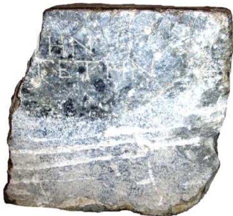
Рис. 2. Посвящение SEG 58:766.

В 2008 г. в научный оборот был введен фрагментированный постамент из частного собрания – случайная находка вблизи участка Р-19 (рис. 2) 14 . На этом основании и с учетом внешнего сходства материала с упомянутыми выше надписями первой половины II в. до н.э., издатель также определил материал посвящения как серый гранит .