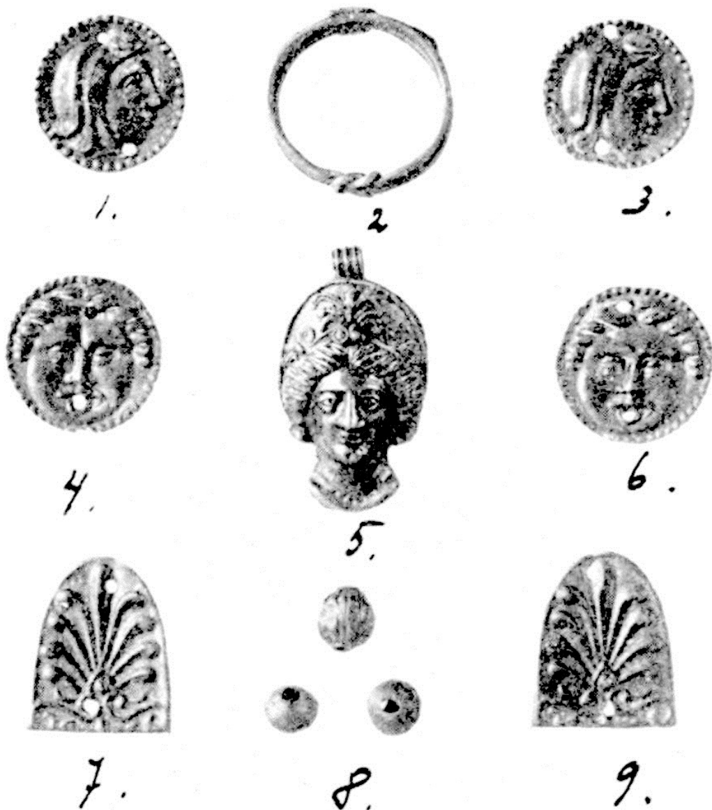
Рис. 8. Золотые вещи из кургана, раскопанного в 1912 г.

Б.В. Фармаковский планировал издать серию отдельных подробных публикаций по раскопкам как ольвийского некрополя, так и городища, как он это делал ранее. Об этом упоминал сам автор, в частности на страницах ОАК за 1912 г. 11 Но этим планам не суждено было сбыться в полной мере, была издана лишь часть находок архаической эпохи на страницах Материалов по археологии России 12 .