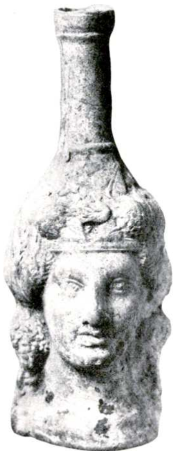
Рис. 5. Фигурный сосуд в форме головы Менады.

(они были изданы в 1908 г.), Б.В. Фармаковский пересмотрел свою точку зрения, предположив, что данные накладки могли быть ручками медных зеркал. Тем не менее, публикация в Archäologischer Anzeiger также важна, поскольку отражает другую, раннюю точку зрения исследователя, а также содержит более качественную фотографию одной из накладок. Отметим, что в монографию Варвары Михайловны Скудной, посвященной архаическому некрополю Ольвии данное погребение не включено, поскольку весь материал из раскопок ольвийского некрополя стал поступать в Эрмитаж (на основе коллекции которого создана монография В.М. Скудной) начиная с 1909 г., а до этого находки также поступали в коллекции Одесского, Николаевского и Херсонского музеев, в также в Государственный исторический музей Москвы.