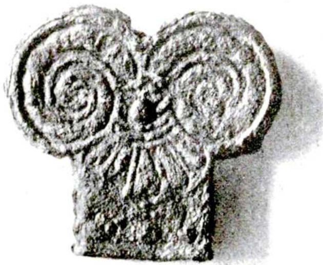
Рис. 4. Бронзовая накладка из ольвийского погребения «5/1905».

Худшая сохранность северной стены относительно западной объяснялась тем, что в начале XIX в. близлежащие крестьяне очень охотно разрушали древние кладки для своих нужд. Тем не менее, общее направление стен определялось еще довольно хорошо. Северная стена цитадели была расположена под прямым углом с востока на запад, лишь немного поворачивая на юг в своей восточной части. Ниже стены находились ямы более раннего времени, затрамбованные известняковым бутом, а также слоями глины и пепла (субструкциями). Также Б.Ф. Фармаковский предположил, что именно в северной стене располагались ворота в цитадель: «согласно топографическим условиям местности, северная сторона террасы является единственной, где может быть главный вход в замок». Ныне это предположение полностью подтвердилось. Б.Ф. Фармаковский датировал первоначальное возведение стены не позднее IV до н.э., отметив, что она: «восходит к греческим временам, но была восстановлена в римские и снова служила уже римской Ольвии» 10 .