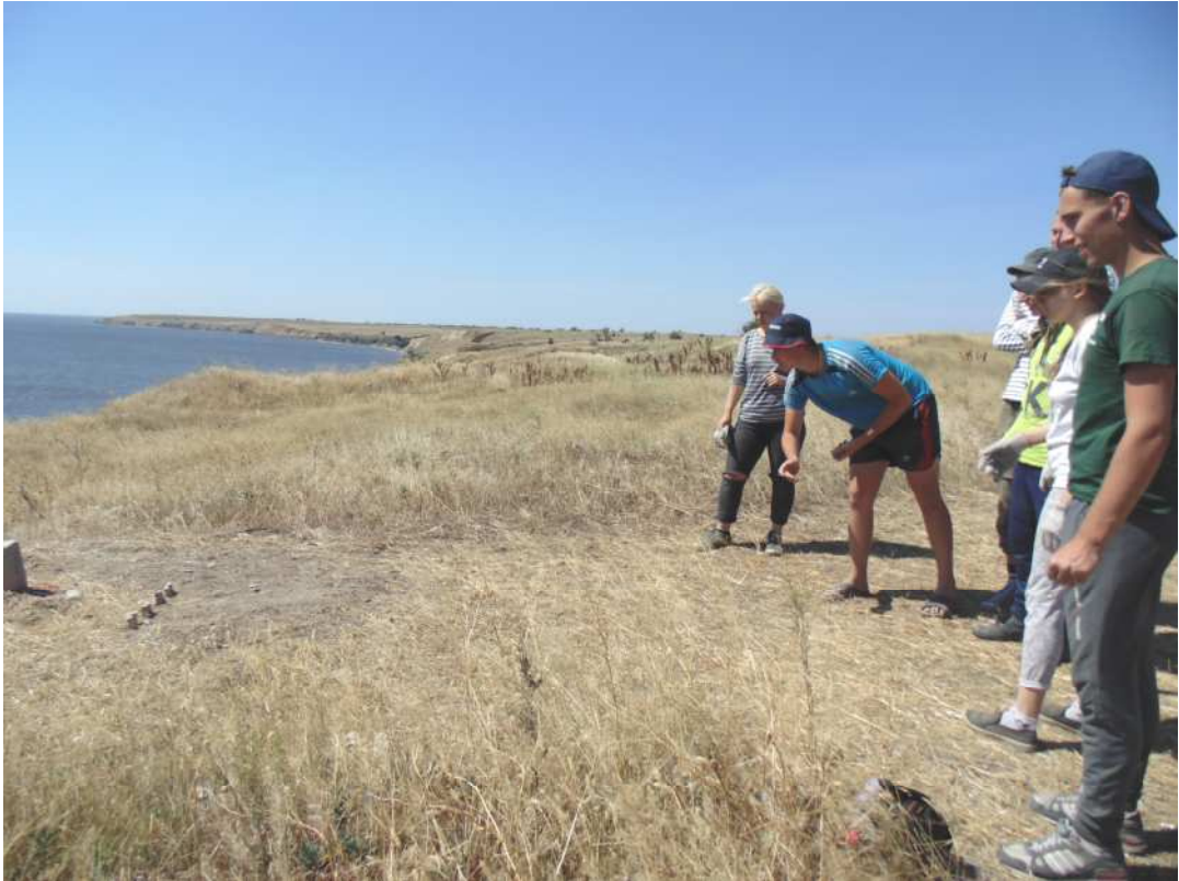
Рис. 5. Реконструкція гри в «бабки» студентами ЛНУ імені Івана Франка

саме астрагали ДРХ. Пізніше цей вид гри став відомий в Україні як один з різновидів «крем'яхів» 16 .