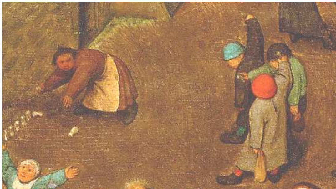
Рис. 2. Гра з використанням фалангових кісток. Фрагмент картини Пітера Брейгеля Старшого «Дитячі ігри», 1560 р. (Художньо-історичний музей ( Kunst Historisches Museum ), Відень, Австрія)

Якщо звернутись до історичних і фольклорних джерел, то ми можемо спробувати реконструювати загальні правила гри. За вмістом кісток вона дуже схожа на поширену у східних слов'ян гру «паці» або «бабки», хоча у більшості випадків пов'язують її з астрагалами 10 .