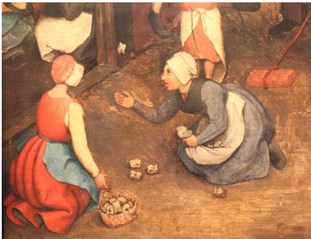
Рис. 3.1. Гра з використанням астрагалів: фрагмент картини Пітера Брейгеля Старшого «Дитячі ігри»

Дослідники дитячих ігор наголошують на консервативності правил деяких з них, внаслідок чого спостерігалася подібність правил і майже повний збіг у підборі предметів для гри упродовж тисячоліть 14 .