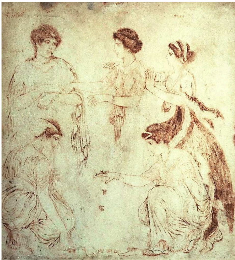
Рис. 3.2. Гра з використанням астрагалів: фреска з Геркуланума.

Через дуже широкий хронологічний діапазон функціонування однотипних ігор вважаємо коректним звернення до живописних творів світового мистецтва більш пізніх періодів. Процес гри знайшов своє відображення і на художніх полотнах. Так, гра у бабки (кеглі) за допомогою фалангових кісток відображена на полотні «Дитячі ігри» 1560 р. (рис. 2), яка вона стала візуальним відтворенням майже 100 дитячих ігор. Цікаво, якщо поррахувати кількість гральних предметів у стіні, то їх вісім (одну кістку дівчинка тримає у руці), а хлопчики вибивають їх битками. На користь можливості пошуку аналогів гри у більш пізніх зображеннях свідчить сцена з полотна П. Брейгеля Старшого, на якій дві дівчинки граються астрагалами – таранними кістками (рис. 3, 1). Ця сцена дуже нагадує процес гри з відомої фрески з римського Геркуланума – дві дівчини, що присіли, підкидають астрагали, а між ними лежать кістки, які впали (рис. 3, 2).