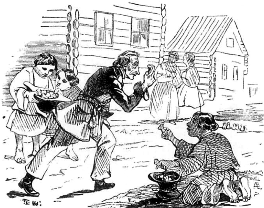
Рис. 4. Сучасна реконструкція гри в «бабки» (Національний історико-археологічний заповідник «Ольвія», 2018 р.)

На всіх роботах показано, що паці розставляли рядочком або попід стіною будівлі (як у П. Брейгеля Старшого), або впоперек вулиці (як у Т.Г. Шевченка), і цю шеренгу треба було зруйнувати влучними ударами биткою. Брало участь у грі, як правило, хлопчики та дорослі чоловіки.