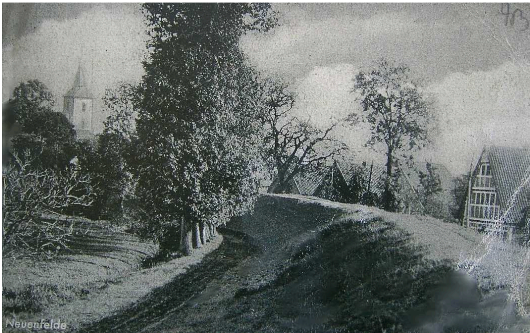
Фото 11-12. Neuenfelde/ bez. Hamburg, Kirchenweg. Зображення на поштових листівках (ДАМО. Ф. Р-2083. Оп. 1. Спр. 540)