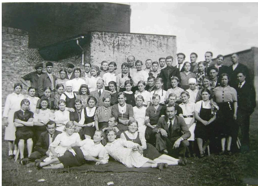
Фото 9. Група примусових працівників. Тарновець, Польща.