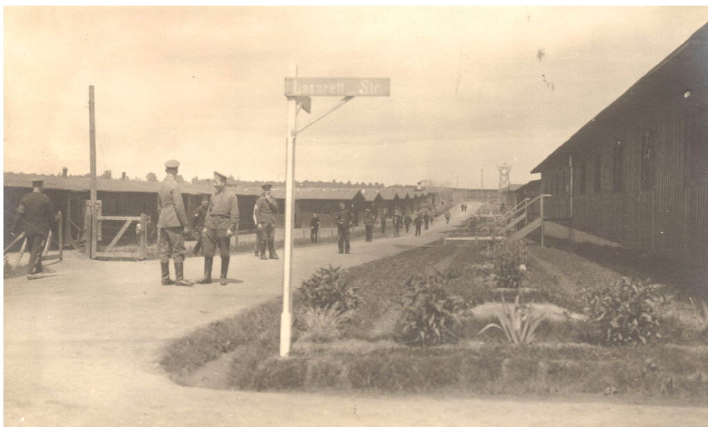
Рис. 1. На перехресті двох «вулиць» табору Вецяра – «Шпитальної» («Lazarett Strasse») і вулиці Кайзера Вільгельма («Kaiser Wilhelm Strasse»), б.д.

Завдяки появі української преси в таборі та щоденним зусиллям українських активістів і членів Просвітнього відділу СВУ стало можливим збільшити кількість учнів у таборній школі. Вже у грудні 1915 р. було відкрито другий відділ для «науки грамоти», де навчалося 65-90 таборян. За проханнями полонених у школі почалося викладання таких предметів як медицина (викладав полонений фельдшер), географія; крім того, силами полонених (колишніх агрономів) були організовані курси сільського господарства. Станом на кінець 1915 р. таборову школу відвідувало близько 200 осіб 16 .