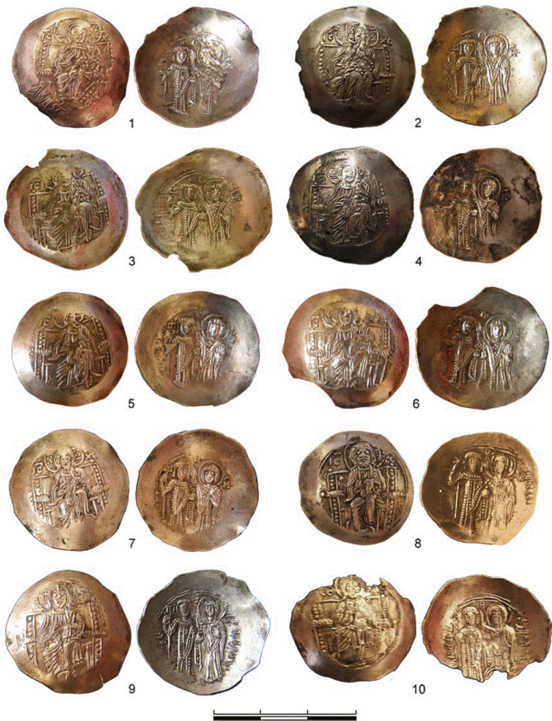
Рис. 1. Монети з поховання алана поблизу с. Суворове (Ізмаїльський р-н, Одеська обл.)