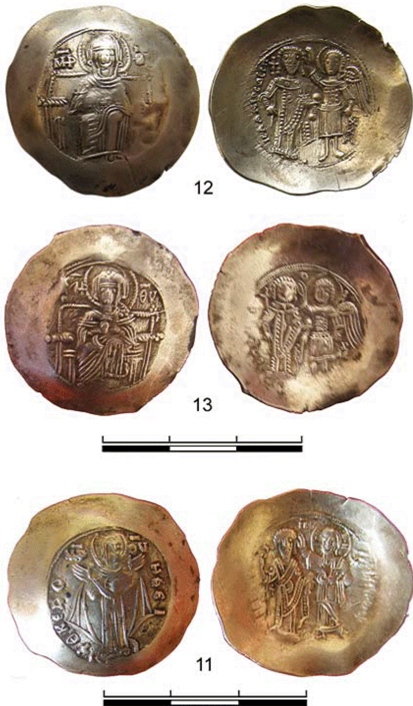
Рис. 1. Монети з поховання алана поблизу с. Суворове (Ізмаїльський р-н, Одеська обл.) (завершення)