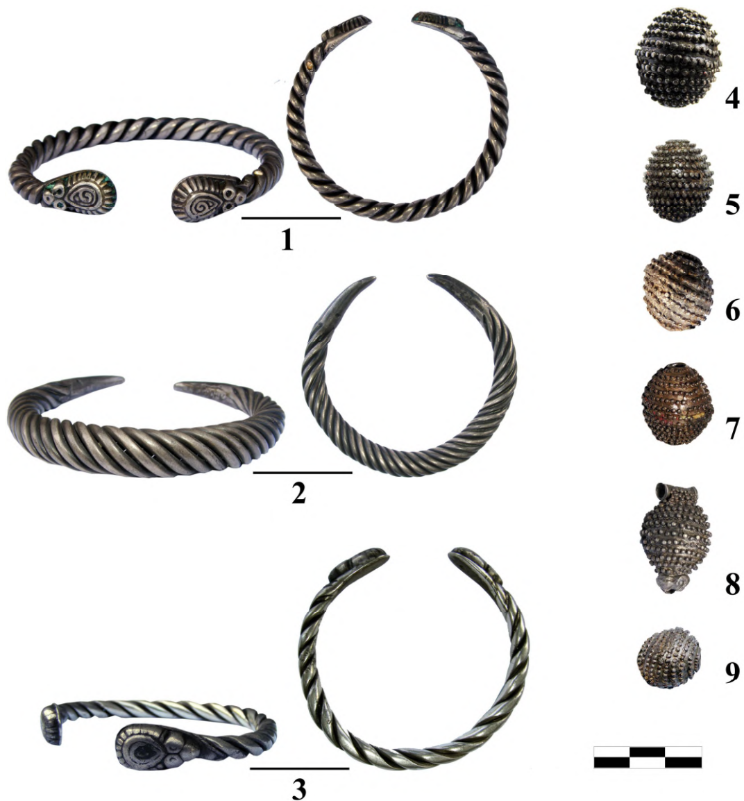
Рис. 1 (початок). Городищенський скарб 27 . 1-3 – браслети, 4-9 – намистини