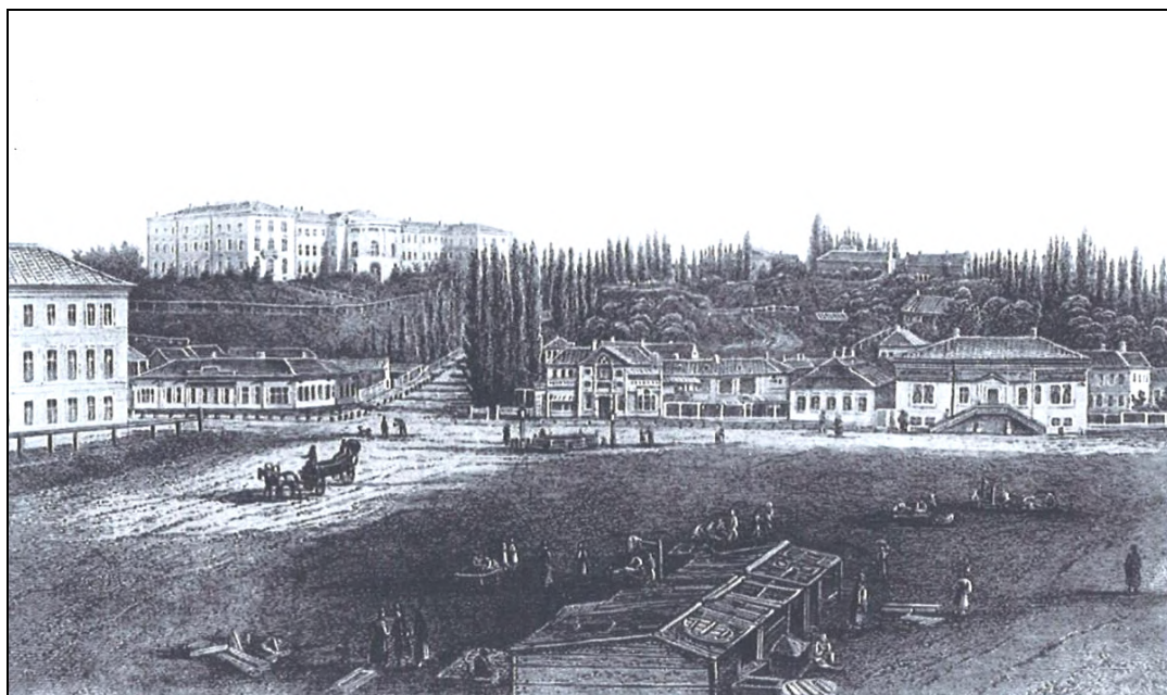
Рис. 2. Хрещатик і початок вулиці Інститутської Вид на Київський інститут шляхетних дівчат з сучасного Майдану Незалежності (світлина кінця 60-х років XIX століття, Й. Кордиш)

інститутській лікарні побували всі інститутки (209 осіб) і щоденно там обстежували приблизно п'ять осіб 3 . У медичному звіті за 1884 р. зафіксовано 606 візитів інституток до лікарні, у середньому по 6 дівчат щодня 4 . У медичному звіті за 1903-1904 рр. вказувався процент слабких здоров'ям дівчат – 64,5% із загальної кількості 293 (хоча це був найменший показник серед інститутів шляхетних дівчат на українських землях у складі Російської імперії 5 ), тому не дивно, що дівчата зверталися про допомогу до лікарів і медперсоналу. На що саме хворіли вихованки, можна побачити у Таблиці 1.