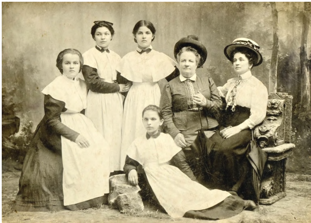
Рис. 3. Дівчата випуску 1917 року з класною дамою