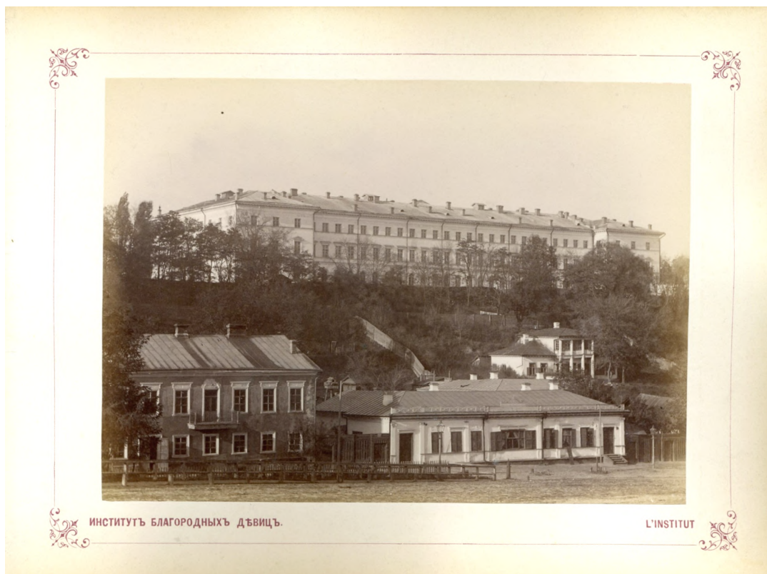
Рис. 1. Київський інститут шляхетних дівчат (вид з Дніпровської Набережної) (Поштова листівка кінця XIX – початку XX ст.)

Велику увагу в школі-пансіоні приділяли релігійному вихованню та манерам, а також вивченню Закону Божого, російської мови і літератури, арифметики, фізики, природознавства, географії, російської та всесвітньої історії, письма, малювання, рукоділля, іноземних мов (французької, німецької), танців, музики та співів. Протягом навчання панянки постійно проживали у закладі, відлучаючись додому лише на канікули й на такі свята як Різдво і Великдень 2 . Щоб їм було комфортно навчатися, колектив закладу повинен був забезпечити вихованок базовими потребами, до яких можна віднести і медичний догляд.