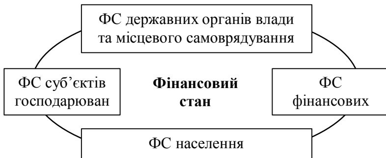
Рис. 1. Фінансовий стан регіонів

ФСР визначають різні за змістом прояви регіональних фінансів, які мають георозподілений характер і формуються в результаті діяльності суб'єктів фінансових відносин на території регіонів. Тому, на нашу думку ФСР необхідно розглядати як закономірне поєднання двох основних проявів – функціонального та змістовного. Відповідно до першого ФСР є закономірним поєднанням ФС суб'єктів фінансових відносин (органів державного управління, місцевого самоврядування, суб'єктів господарювання, фінансових інституцій, населення (домогосподарства)) (рис. 1), відповідно до другого – об'єктивно існуючих сутнісних аспектів і ознак регіональних фінансів.