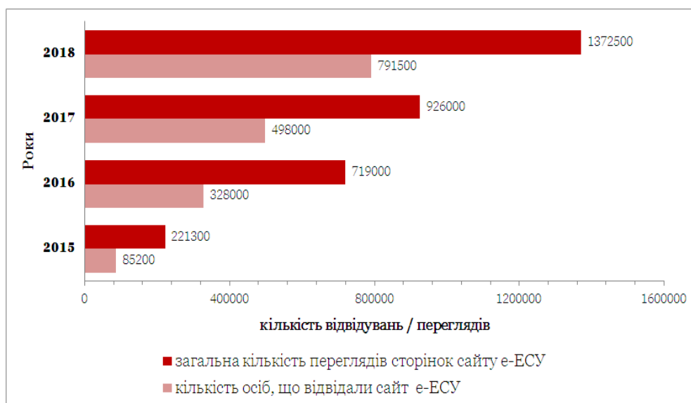
Рис. 1. Показники відвідуваності сайту електронної «Енциклопедії Сучасної України» за 2015–2018 рр.

Томи ЕСУ друкують накладом 10 000 примірників, безплатно роздають державним бібліотекам, університетам. Утім завдяки е-ЕСУ доступ кількості читачів до енциклопедичної інформації істотно збільшується. Про це, зокрема, свідчать статистичні дані з адміністративної панелі сайту енциклопедії (рис. 1).