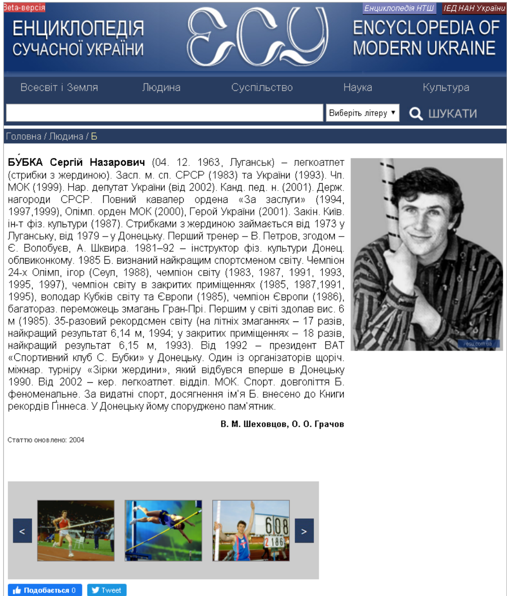
Рис. 2. Стаття про Сергія Бубку на сайті «Енциклопедії Сучасної України» ( http://esu.com.ua/search_articles.php?id=36402 )