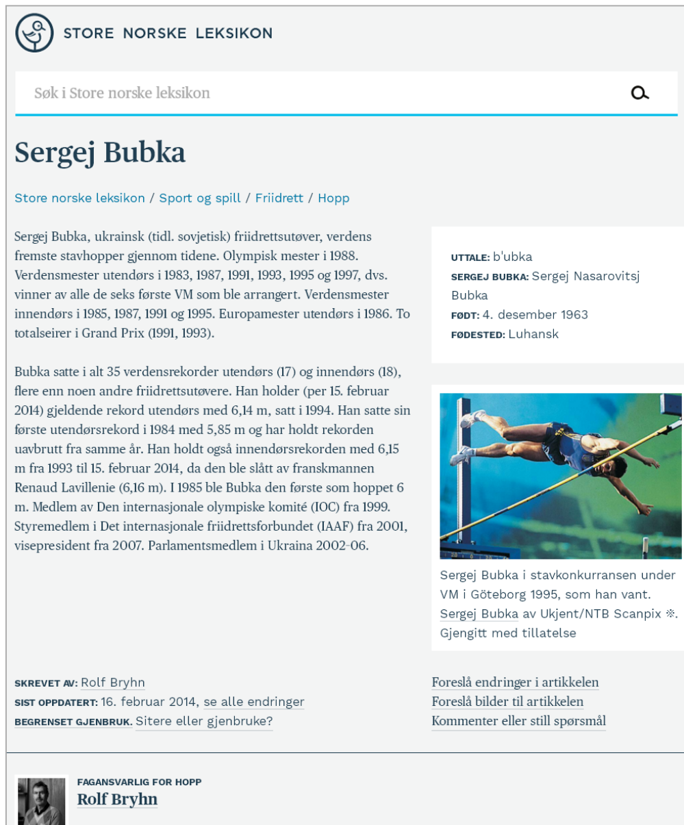
Рис. 4. Стаття про Сергія Бубку на сайті «Store Norske Leksikon» ( https://snl.no/Sergej_Bubka )

З рис. 2–4 бачимо, що три статті мають багато схожих елементів – заголовок, текст статті, фотоілюстрація, авторство, дата створення та оновлення. До слова, в іноземних енциклопедіях ім'я С. Бубки подано російсь-