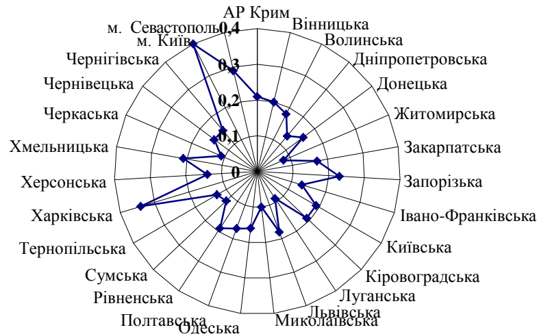
Рис. 3. Коефіцієнт використання місткості готельного комплексу*

На наявність цих елементів інфраструктури особливо варто звернути увагу нині, коли Україна активно готується до зустрічі туристів, які мають приїхати у зв'язку з проведенням фінальної частини Євро-2012 з футболу на території чотирьох міст. Останнє зумовлює необхідність активізації розвитку готельної мережі. Якщо протягом 2004–2006 років абсолютний приріст готелів становив 31 одиницю, то за 2007–2009 роки – 52 одиниці. Пік зростання припав на 2009 рік, коли за один рік загальна кількість готелів, мотелів, готельно-офісних центрів збільшувалася на 2,4% [5, с. 144].