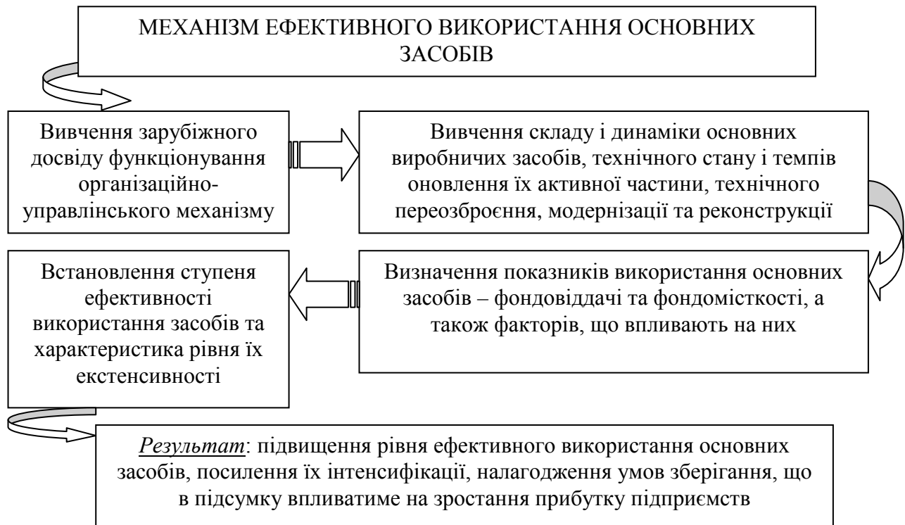
Рис. 3. Механізм забезпечення ефективного функціонування основних засобів

його діяльності в перспективі на основі оптимізації співвідношення між вирішенням поточних та запланованих завдань розвитку.