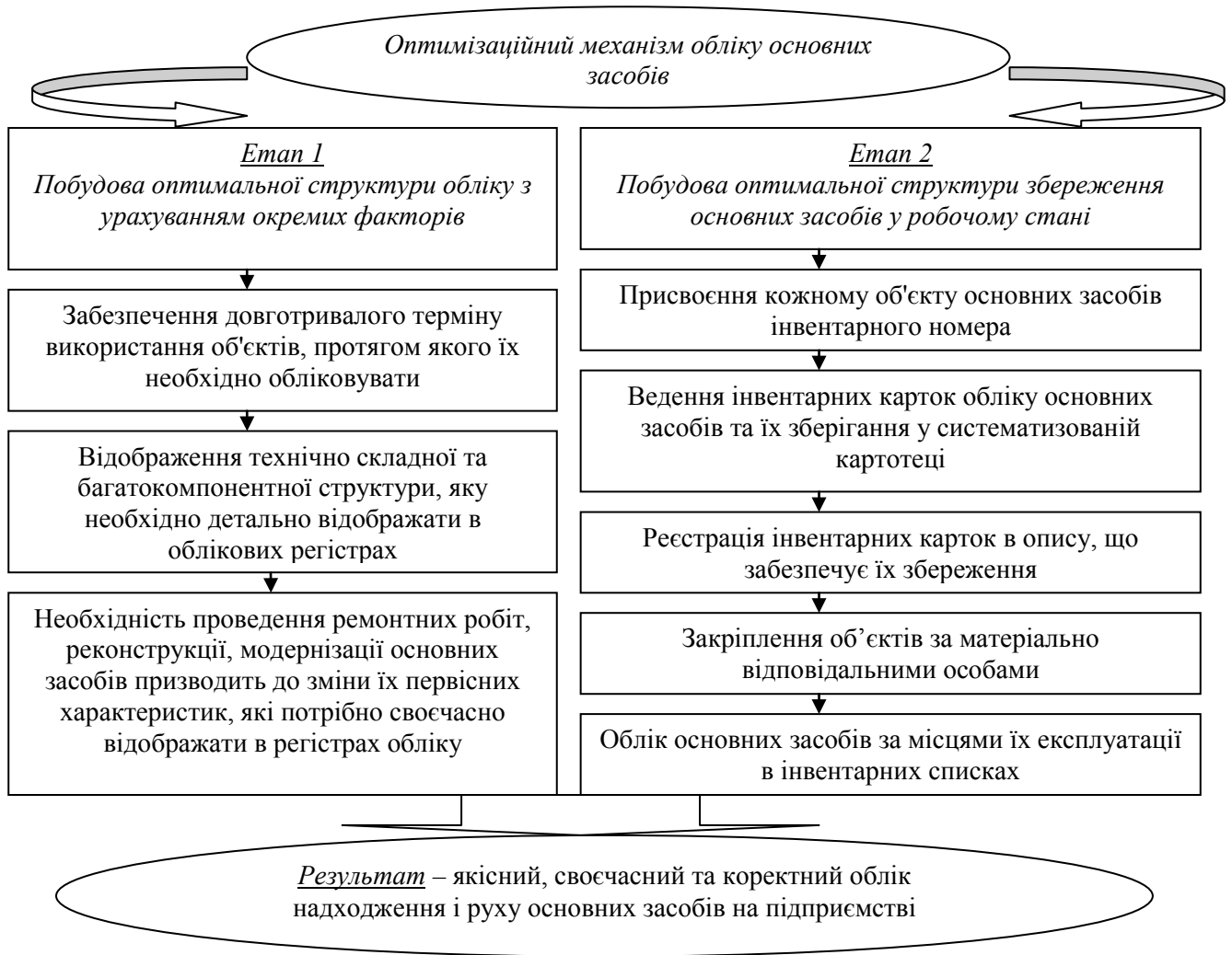
Рис. 1. Структура оптимізаційного механізму управління обліком основних засобів на підприємстві