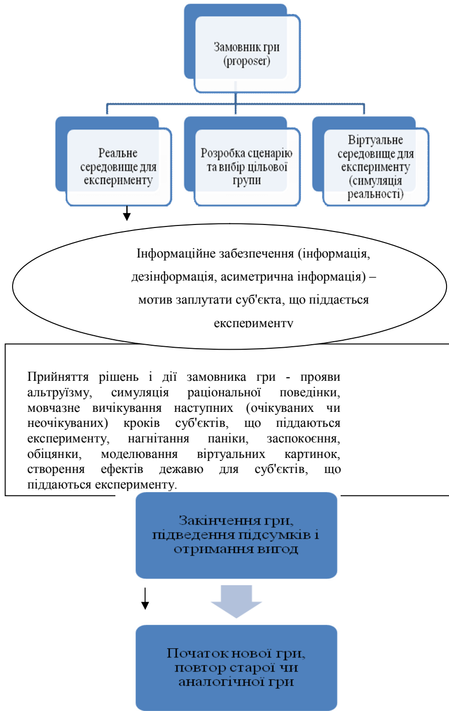
Рис. 2. Теорія гри диктатора

експерименту, є порушенням прав людини, - слід говорити, що така епоха настає на рівні бізнесу, держави, в міжнародній регіональній і глобальній економіці тощо. Після проведеного експерименту гравець-замовник гри аналізує і оцінює її результати і робить наступний крок: продовжує ту ж саму гру (якщо спрацьовує ефект затягування часу відповіді суб'єкта на гру), розпочинає аналогічну/схожу гру (ефект «дежавю» і дереалізації подій), або закінчує гру, відновлює об'єктивну ситуацію і готується до нової гри, маючи знання про результат.