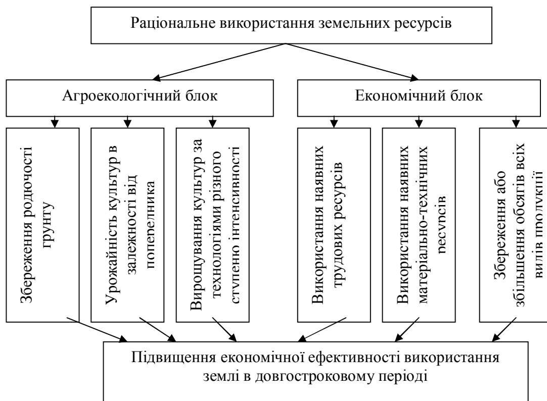
Рис. 1. Схема організації раціонального використання земельних ресурсів

Виклад основного матеріалу. Використання земельних ресурсів може бути визнано раціональним в тому випадку, якщо воно задовольняє економічні потреби в рамках екологічно підходу, а економічна діяльність здійснюється з дотриманням екологічних вимог, спрямованих на охорону землі як бази природокористування (рис.1)