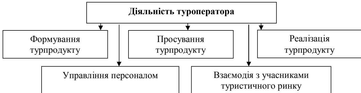
Рис. 3. Структура об’єкту „діяльність”

Проходження організаційної практики має на меті дослідження визначених об’єктів, але в контексті організаційного аспекту, а саме: ознайомлення з основами договірних відносин на туристичному підприємстві, вивчення особливостей укладання договорів між туроператором і постачальниками послуг, в якості яких виступають засоби розміщення, заклади ресторанного господарства, транспортні підприємства, заклади дозвілля; партнери – ініціативні та рецептивні туроператори, туристичні агентства; споживачі.