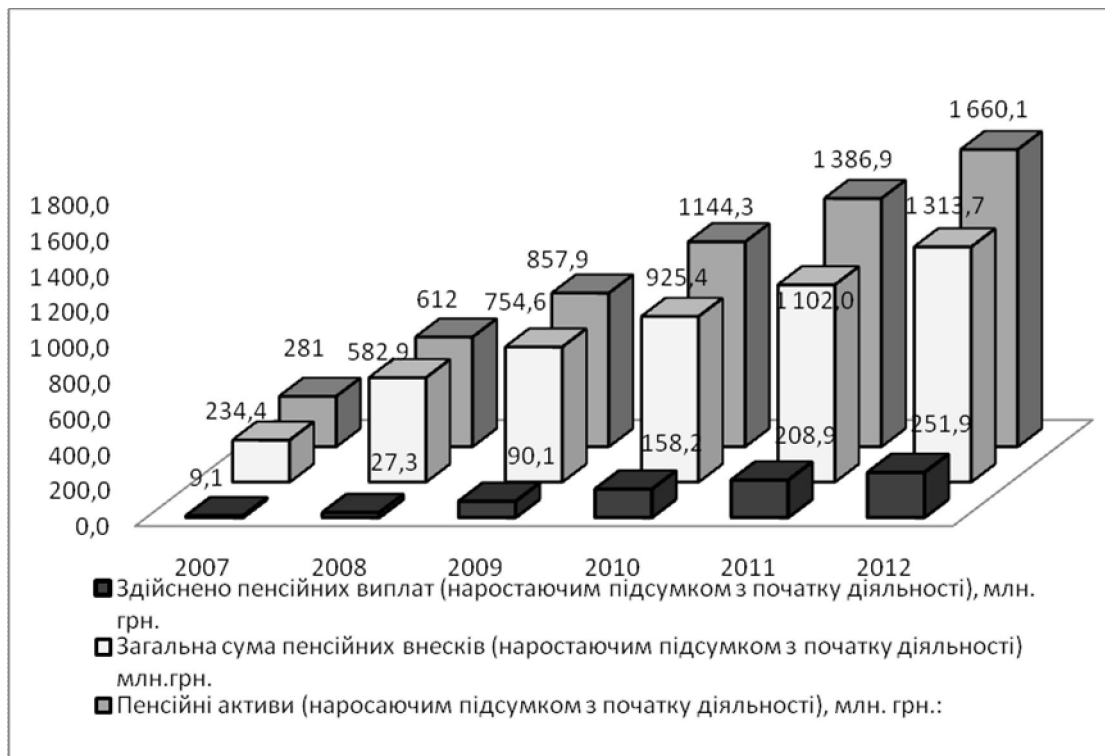
Рис. 3. Обсяг пенсійних виплат внесків та пенсійних активів [12]

З рис. 3 видно, що в порівнянні з 2007 р., у 2012 р. обсяг пенсійних активів збільшився в 5,9 раз, і склав 1660,1 млн. грн., що на 273,2 млн. грн. більше ніж в 2011 р. Також можна спостерігати за зростанням суми пенсійних виплат та пенсійних внесків, зокрема, в порівнянні з 2007 р., в 2012 р. суми пенсійних виплат і внесків збільшилися в 27,6 і 5,6 разів відповідно. Абсолютний приріст пенсійних внесків у 2012 р., в порівнянні з 2011 р. становив 211,7 млн. грн. Як бачимо, значного збільшення зазнали пенсійні виплати, що зумовлено розвитком НПФ та збільшенням кількості пенсійних активів, а також збільшенням обсягів пенсійних внесків учасниками недержавних пенсійних фондів.