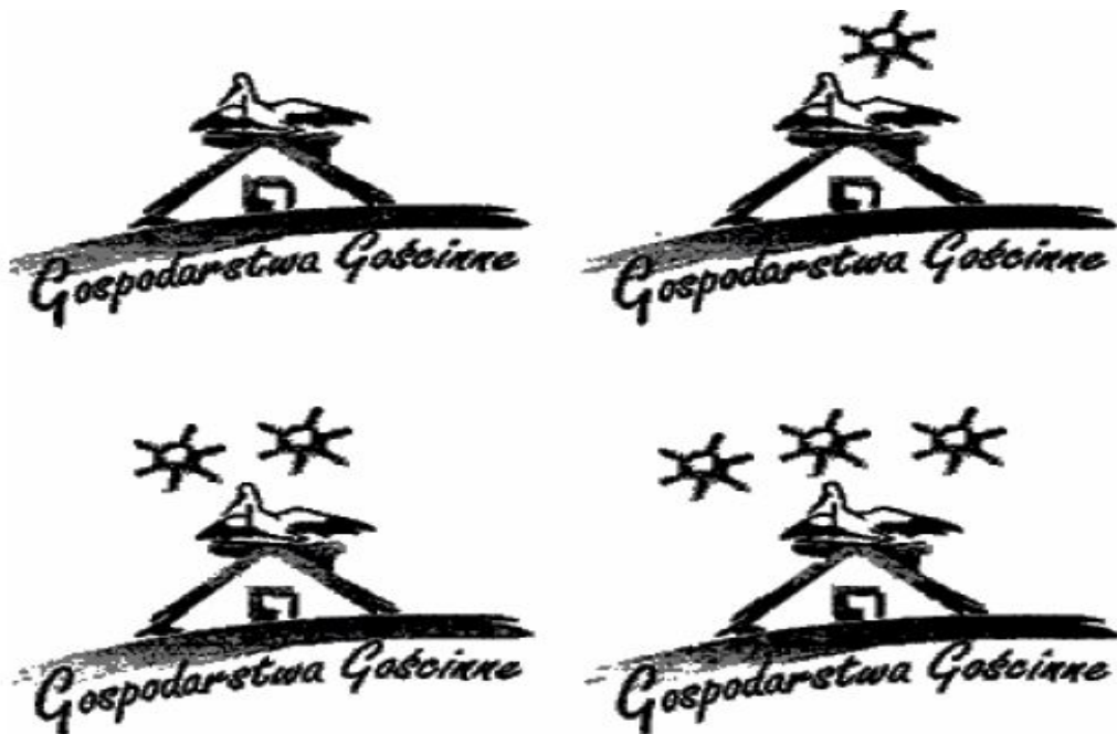
Рис. 3. Система категоризації агротуристичних підприємств у Польщі

Польські підприємці, що займаються агротуризмом дуже часто пропонують послуги різного рівня. Слід зазначити, що у Польщі здобуття сертифікатів, котрі підтверджують рівень якості послуг відповідно до стандартів в агротуризмі не є обов'язковим 10 . „Добровільну класифікацію та стандартизацію агротуристичних підприємств в Польщі здійснює Польська Федерація Сільськогосподарського туризму Гостинне господарство” 11 . Дана федерація поділяє підприємства на категорії, в залежності від рівня стандартів, яких дотримується підприємство. Категорія надається строком на 2 роки. Після спливу терміну дії категорії відбувається чергова перевірка та поновно встановлюється рівень стандарту місць для проживання в агротуристичних підприємствах. Після отримання відповідної категорії стандарту агротуристичне підприємство отримує право використовувати знак Федерації Сільськогосподарського туризму Гостинне господарство (рис. 3).