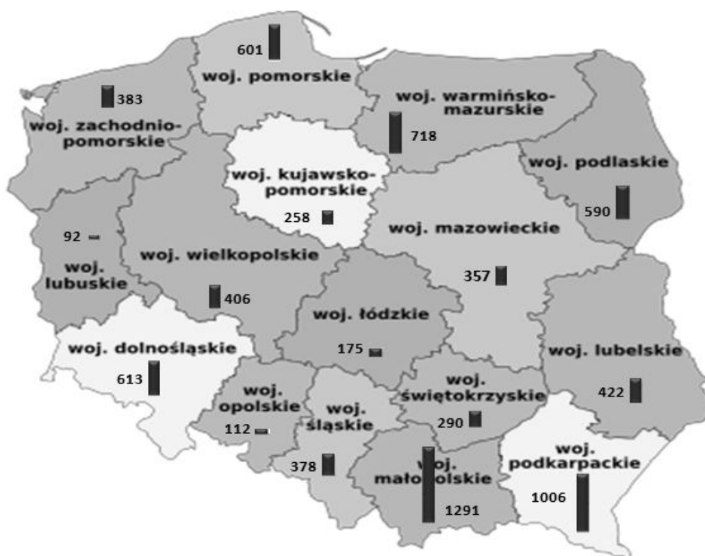
Рис. 2. Агротуристичні підприємства в Польщі за регіонами 2011 р.

Специфіка агротуризму в Польщі залежить від географічного положення, рельєфу, а також від величини та спеціалізації аграрних підприємств. Тому в різних регіонах країни підприємства різко відрізняються. Найбільш сприятливими регіонами Польщі для розвитку туризму є ті, в яких переважає гірський рельєф або є велика кількість водойм (озер, річок, море) 9 .