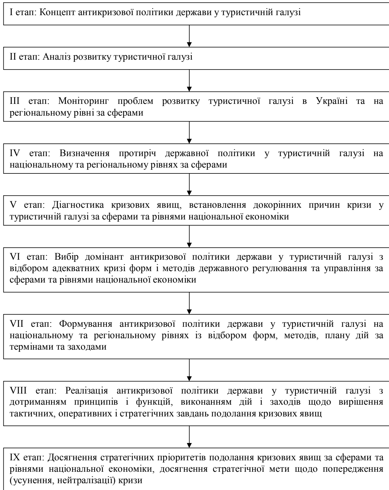
Рис. 2. Структурно-логічна схема концепції антикризової політики держави у туристичній галузі в Україні

проведення необхідних заходів і виконання дій суб'єктом управління за етапами (рис. 2).