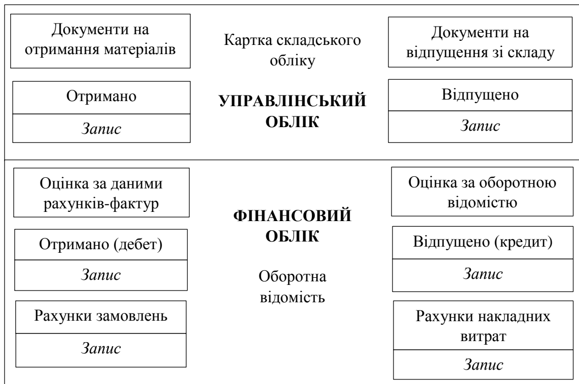
Рис. 3. Процедура обліку матеріалів

складання оборотних аналітичних відомостей на підставі карток складського обліку матеріалів. У цьому проявляється взаємодія фінансового і управлінського обліку в обліково-аналітичній системі підприємства, що показано в загальній схемі облікової процедури. Процедура обліку матеріалів представлена на рис. 3.