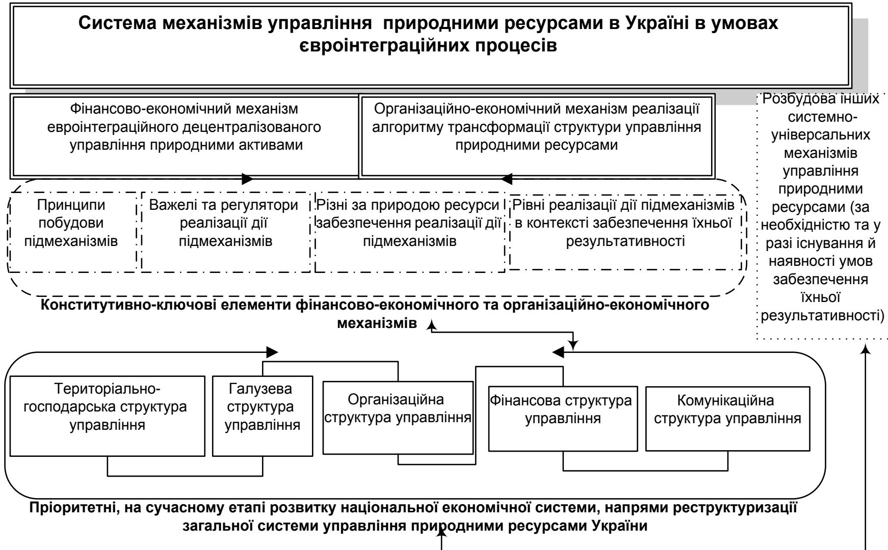
Рис. 1. Теоретико-концептуальні засади управління природними ресурсами України в умовах євроінтеграційних процесів при суттєвих ресурсних обмеженнях (авторська розробка)