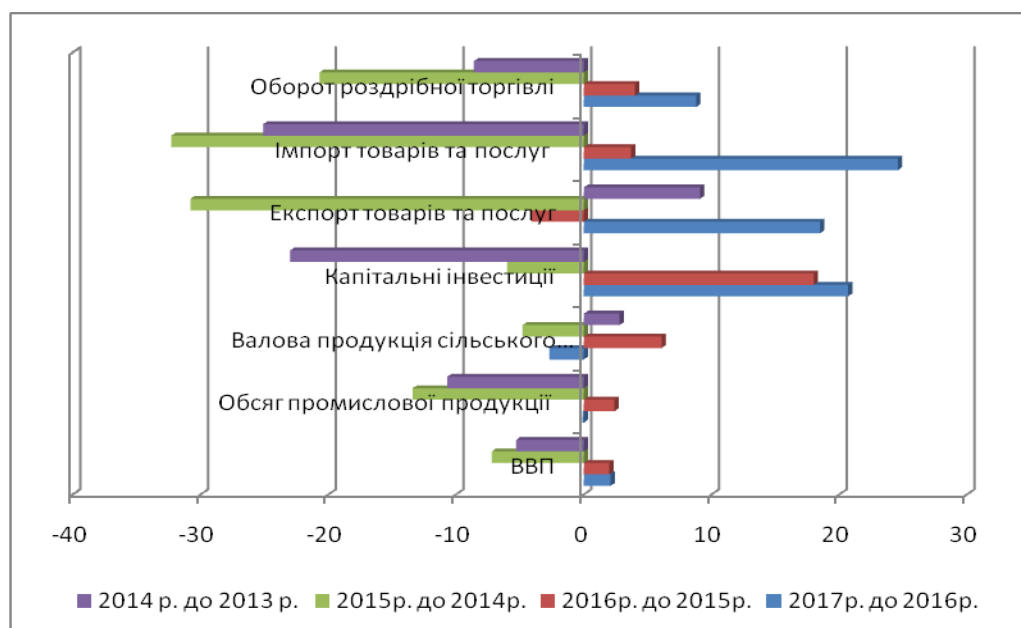
Рис. 3. «Стрибковість» зміни показників економіки України.