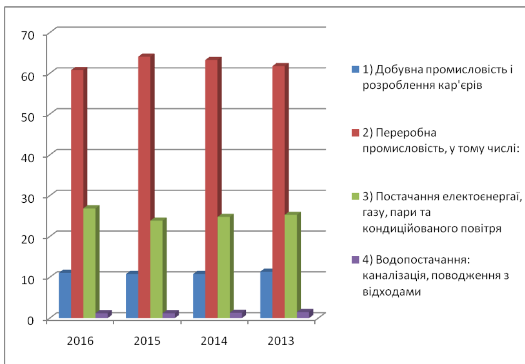
Рис. 4. Динаміка зміни структури реалізованої продукції в Україні

З рис. 4 видно, що найбільші обсяги реалізації продукції становить переробна промисловість, а найменші – добувна.