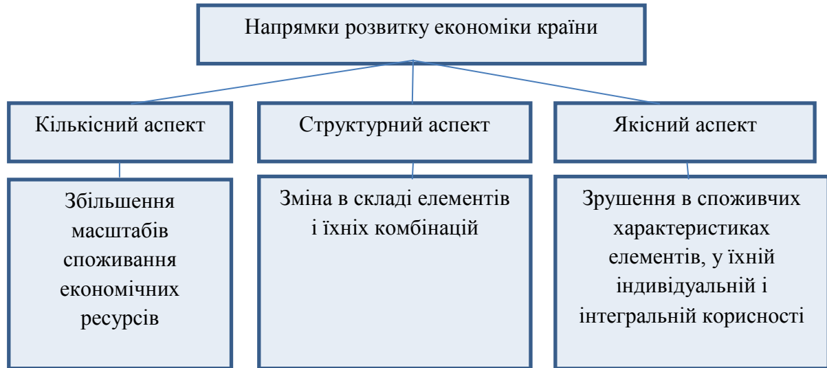
Рис. 1. Характеристика напрямків розвитку економіки країни за теорією

комбінацій – структурний аспект; зрушення в споживчих характеристиках елементів, у їхній індивідуальній і інтегральній корисності – якісний аспект [7].