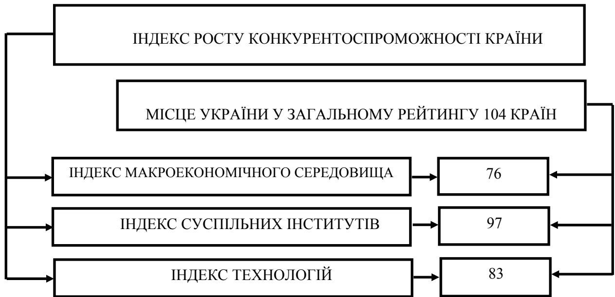
Рис. 1 – Індекс росту конкурентоспроможності України

Нажаль, сьогодні Україна займає останні місця в цьому рейтингу по всім показникам, однак, результати досліджень показали, що найбільшою перешкодою на шляху росту конкурентоспроможності нашої країни є низька якість суспільних інститутів (індекс суспільних інститутів характеризує рівень корупції державних органів, злочинності та захищеності прав громадян). Країна охоплена епідемією корупції та бюрократизму, результат яких – неефективність функціонування економіки і відповідне зниження потенціалу росту України у майбутньому.