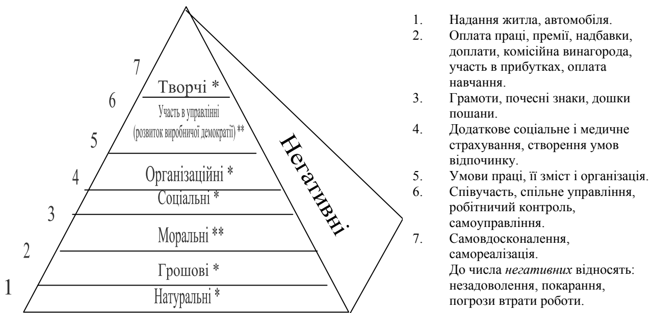
Рис. 1. Форми стимулювання в системі мотивації праці (складено автором)

Примітка. * - підтримуючі фактори (гроші, умови, інструменти для роботи, безпека, надійність); ** - мотивуючі фактори (визнання, ріст, досягнення, відповідальність і повноваження). Присутність обох груп факторів приносить максимальну задоволеність, наявність тільки першого фактора зводить незадоволеність від роботи до мінімуму.