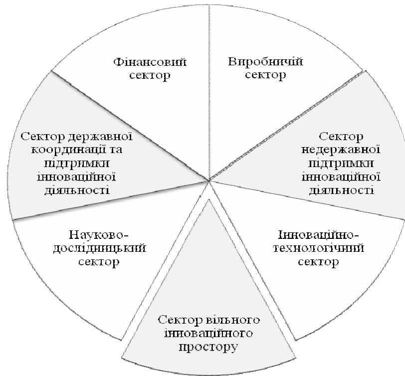
Рис. 1. Структура НІС за функціональними секторами.