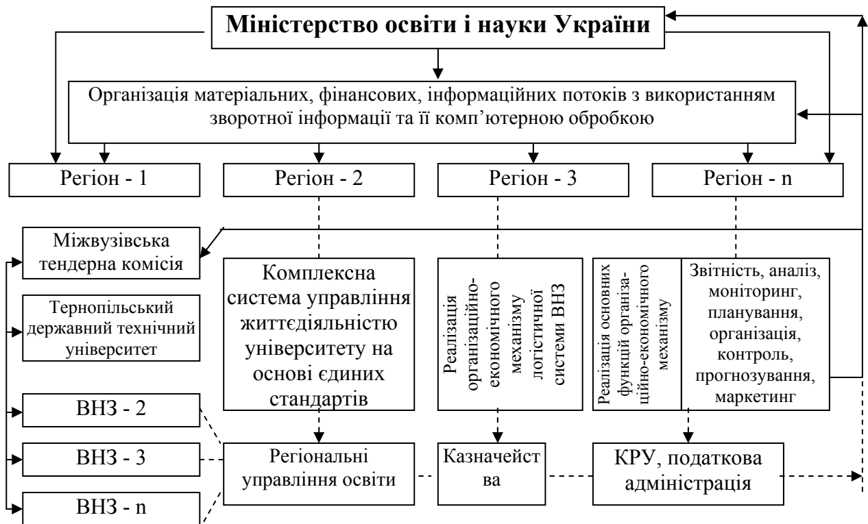
Рис.3. Схема регіональної організації міжвузівського матеріально-технічного забезпечення з використанням логістичного підходу

В результаті впровадження нововведень по-перше: підвищиться оперативність виконання управлінських рішень; за рахунок впровадження електронних схем зв'язку скорочуються витрати на організацію обслуговування навчальних, господарських та інших процесів; підвищується виконавча дисципліна; створюється моральна та матеріальна зацікавленість у творчій праці та ефективному навчанні; спрощується бухгалтерський облік; посилюється контроль за раціональним використанням матеріальних, фінансових та енергетичних ресурсів, інше. По-друге: досягається прозорість всіх господарських організаційно-виробничих та навчальних процесів; впроваджується єдина система діловодства, контролю, звітності;