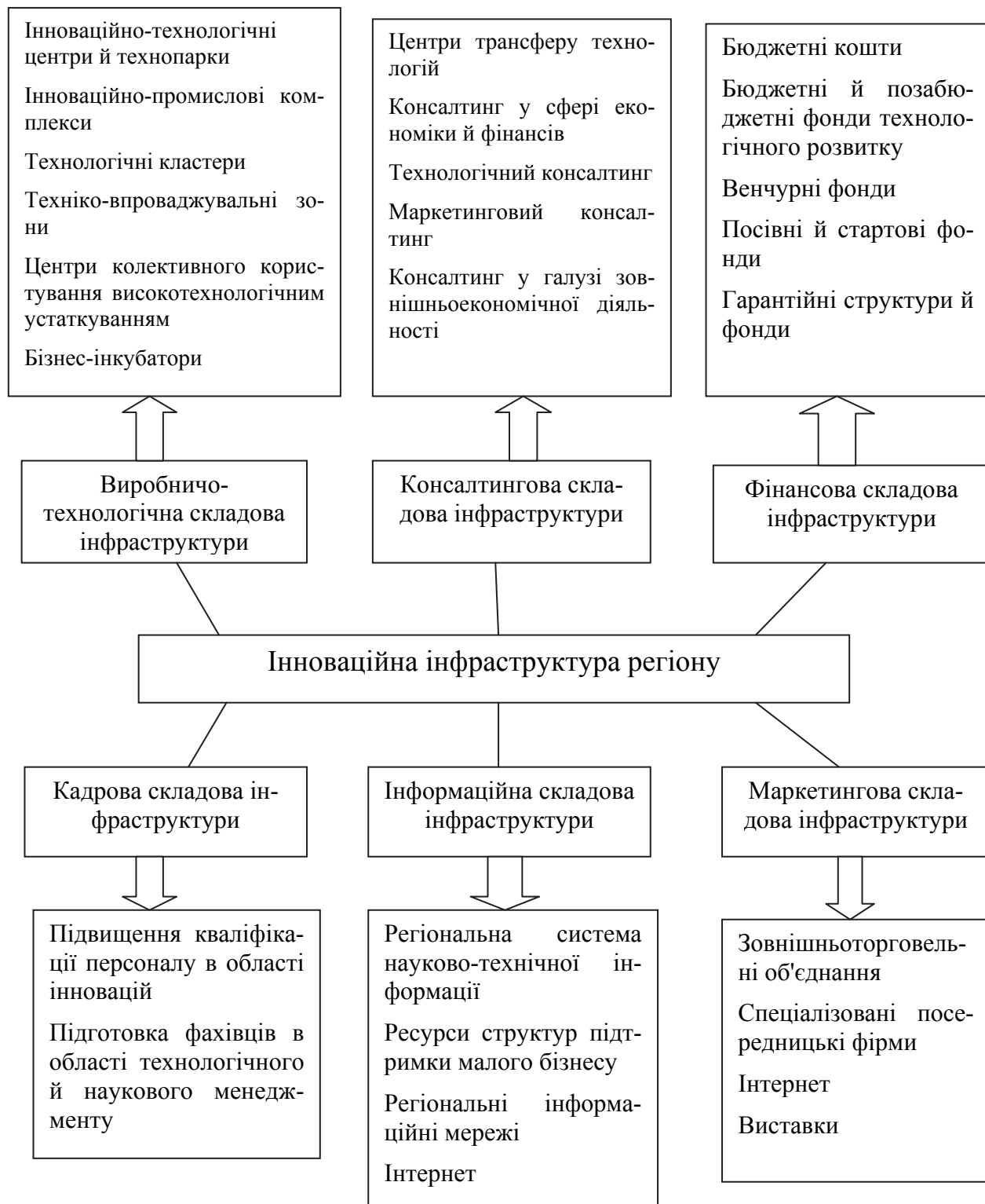
Рис. 2 – Основні складові інноваційної інфраструктури регіону