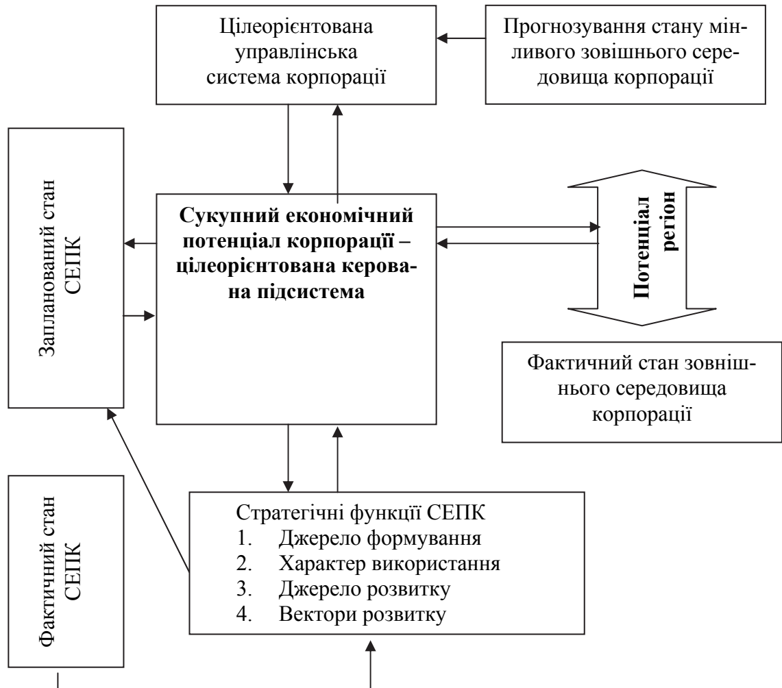
Рис. 3. Місце та роль сукупного економічного потенціалу в системі стратегічного управління корпорацією

чинників його внутрішнього й зовнішнього середовища є можливість виокремлення трьох основних груп суперечностей: між зовнішнім і внутрішнім середовищем; між короткостроковими й довгостроковими цілями функціонування корпорації; між цілями окремих учасників, у тому числі регіону, та цілями корпорації в цілому.