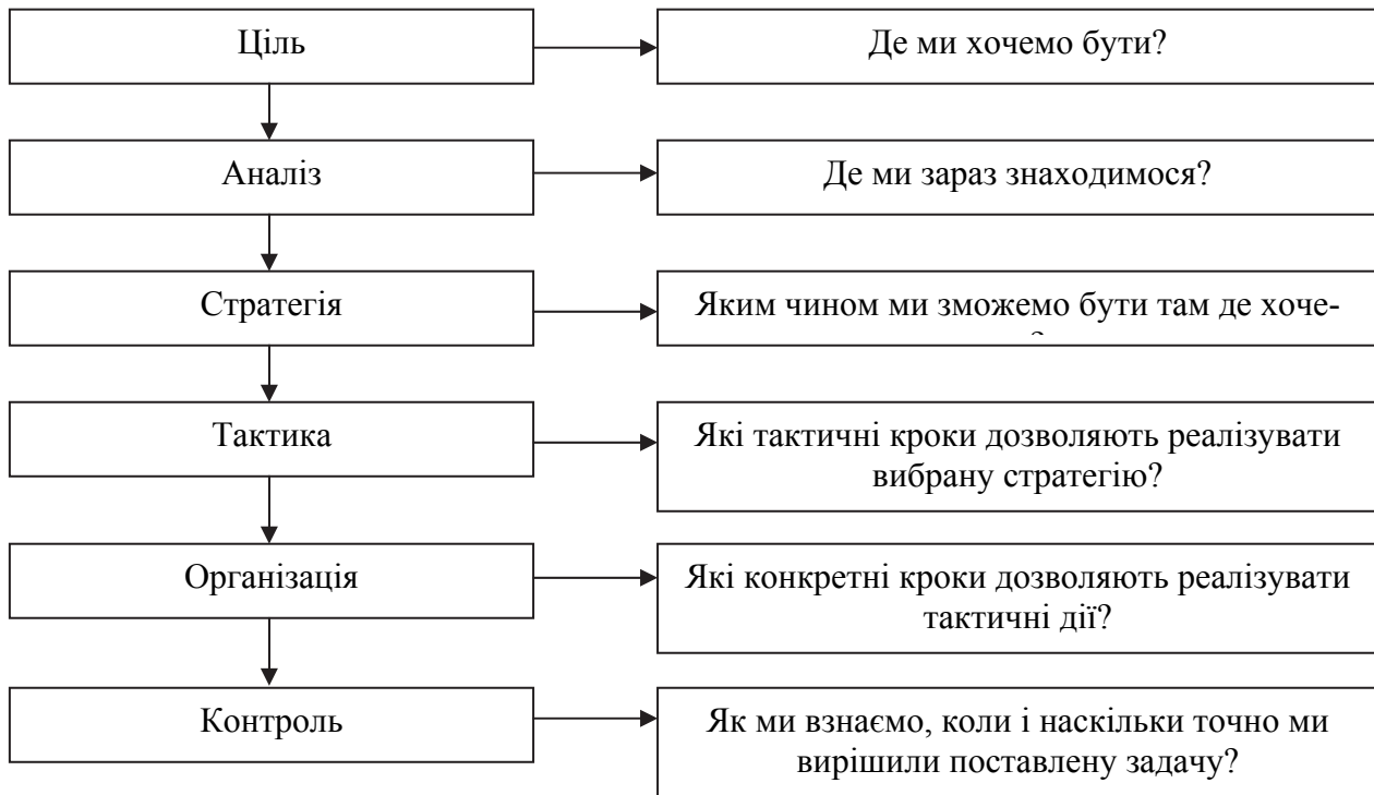
Рис. 1. Система управління маркетинговими комунікаціями

При цьому, як показав проведений аналіз, дана стратегія повинна передбачати органічне поєднання всіх засобів і методів маркетингових комунікацій, вигідно використовувати синергетичний ефект від їх комплексного застосування.